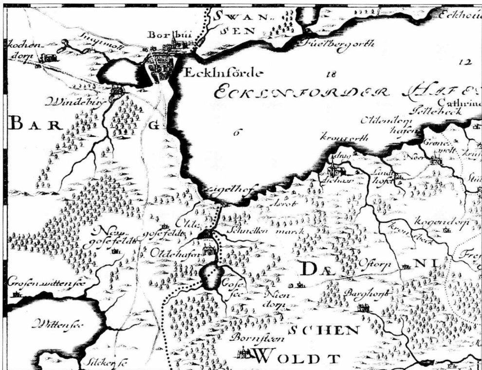
Kort over Eckernförde med godset Vindeby lige syd for. Bemærk de store skovområder, hvor svinene kunne gå på olden. Mod nord er halvøen Svans, mod syd Dänischwohld.

(Caspar Danckwerth: Neue Landesbeschreibung der zwei Hertzogthümer... , 1652).