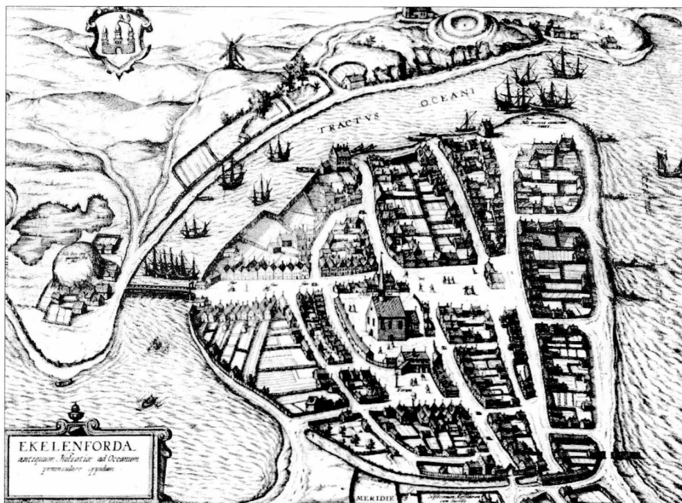
Prospekt af Eckernförde, formentlig 1585-88. (Braun og Hogenbergs Theatrum Urbium).