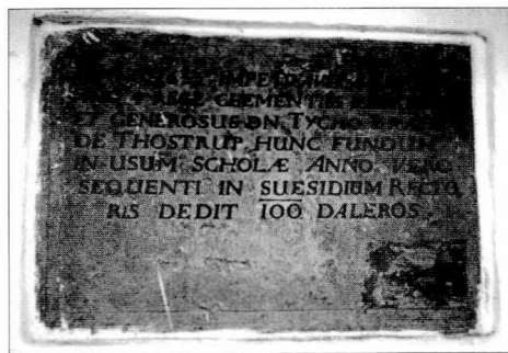
Tavle indsat i skolen i Fakse, der markerer skolens officielle foundation i 1633.

Det er i det hele taget karakteristisk, at de klassiske kildetyper endnu ikke har noget som helst "skolehistorisk" sigte, men alene kan give en passant-indtryk, især i sager om værgemåls påtagelse, respektive aflæggelse af regnskab desangående. Dertil optræder skoleholdere (såfremt de ikke samtidig var degne eller substitutter og følgelig benævnes som sådan) sporadisk i skifter og gældssager, således også i udgaven af Køgeskifterne, hvor vi i 1649 møder såvel en skolemester i Herfølge som enken efter skoleholderen i Terslev. 17