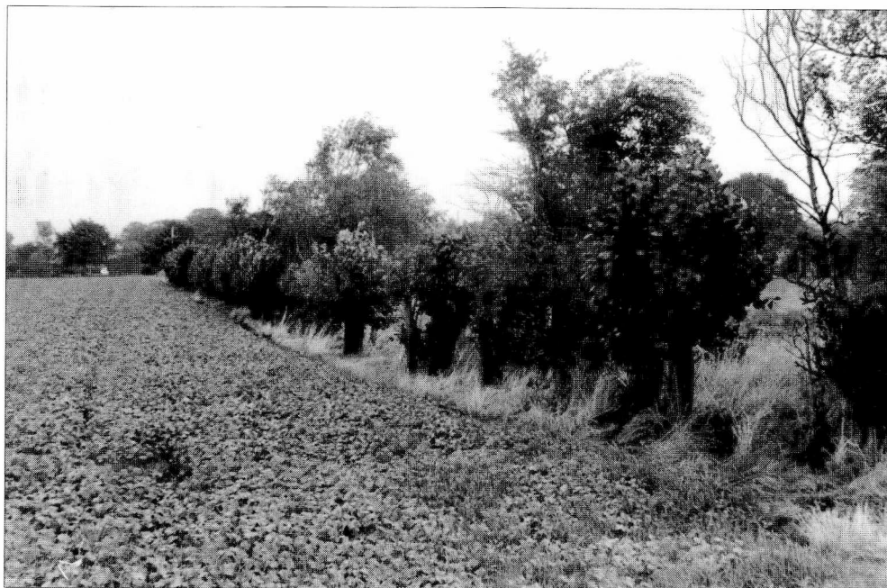
Markskel med levende hegn bestående af lavt stynede træer. Gimlinge, Gimlinge sogn.

grænser. Senere kom en modsatrettet tendens, hvor behovet for en meget intensiv udnyttelse af al til rådighed værende jord betød nedlæggelse af mange hegn. Jordvoldene blev gravet væk, mens nedtagningen af nogle stendiger indgik i beskæftigelsesforanstaltninger i 1930'erne. Stenene blev taget ned og slået til skærver, og hvor det skete, kan en del af dem stadig erkendes under jordoverfladen. Lodsejerne kan berette, at en del af de derved fremkomne skærver blev anvendt som stabilisering under Hit-