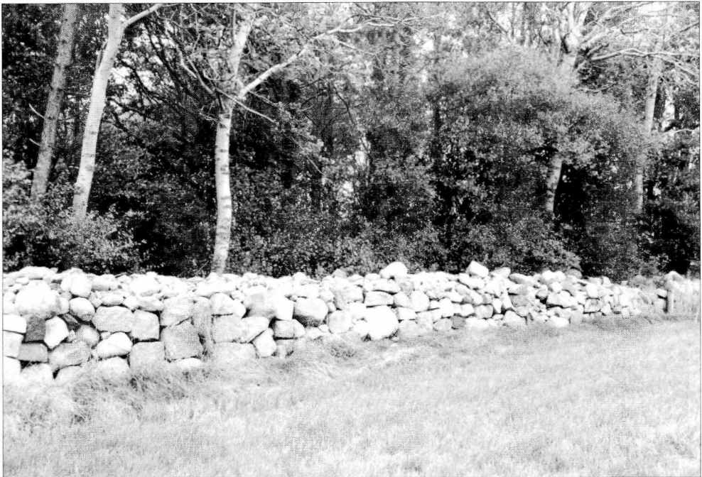
Stendige mellem mark og skov. Alleshave, Bregninge sogn.