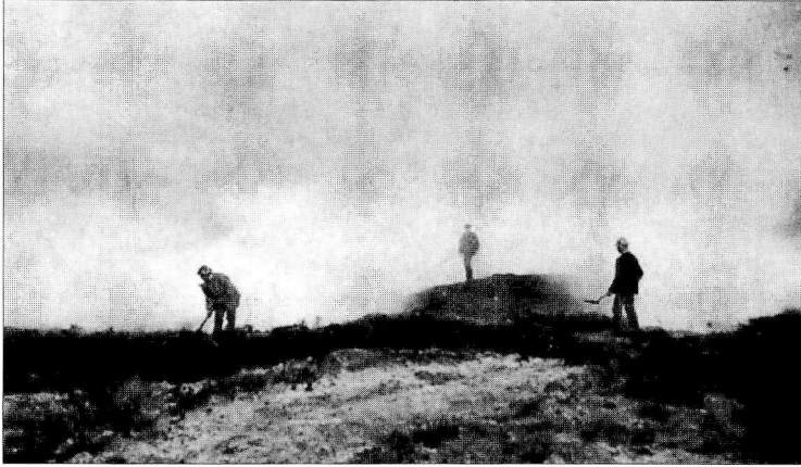
Før et stykke hede blev indtaget til dyrkning, skulle lyngtæppet fjernes, hvilket foregik ved afbrænding. Billedet viser, hvorledes man holdt ilden i ave med skovle og branddaskere. Efter Danmarks Natur bd. 7, 1970.

ringe endda: På Villestrup forsøgsstation foretog man i årene mellem 1916 og 1918 forsøg med toplyng som kreaturfoder, og disse forsøg viste, at lyn-gen placerede sig på en skala mellem dårligt og middeldgødt enghø (omdannet til lyngmel). 4 Af denne grund forsøgte allerede den tidlige middelalders kvægavlende hedebønder at holde hederne og lyngen ved magt. Skov gav kun føde til svin, mens heder gav føde til næsten alle typer husdyr. Lyngen og mosetørven kompenserede desuden for de manglende skove som brændselsmiddel. Der var altså rationelle grunde nok til at foretrække hederens åbne vidder frem for skovenes tætte og ufremkommelige mørke.