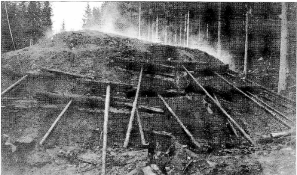
Brenning av kullmile.

Til slutt skal vi gi et eksempel på hvor omfattende bondearbeidet kunne være, både pliktarbeid og all slags frivillig arbeid. Ved de to jernverk i Asker og Bærum prestegjeld, Dikemark og Bærum jernverk, er det be-