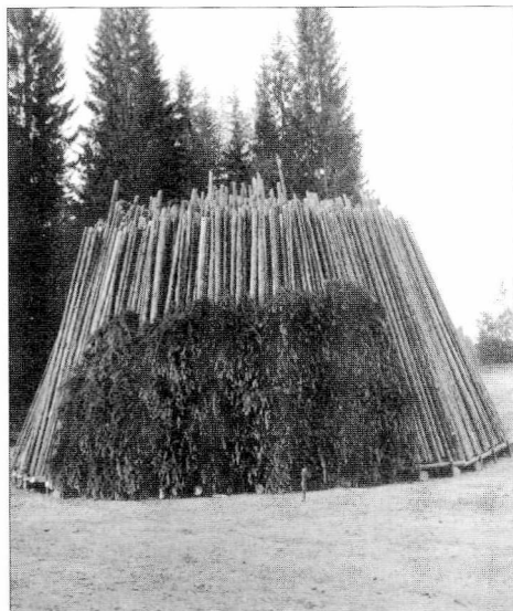
Baring av mile.

Ved Kongsberg sølvverk var det totale forbruket av skogprodukter på 100.000 kubikkmeter i året under stordriften på slutten av 1700-tallet. Behovet for bondearbeid var derfor stort. De nærmest liggende gårder i de tre fylkene Buskerud, Vestfold og Telemark ble trukket inn i Sølvverkets interesseområde. Fra omkring 1720 var ca. 2.000 gårdsbruk pålagt pliktarbeid. Rundt 1800 var det 12.000 gårdsbruk i de tre fylkene. Antakelig var rundt 4.000 av dem, eller en tredjedel, involvert i arbeid for Sølvverket og de seks jernverkene, fordelt med halvparten på Sølvverket og halvparten på jernverkene. 6 Ved Røros kobberverk arbeidet 1900-2000 verksarbeidere og bønder. 7