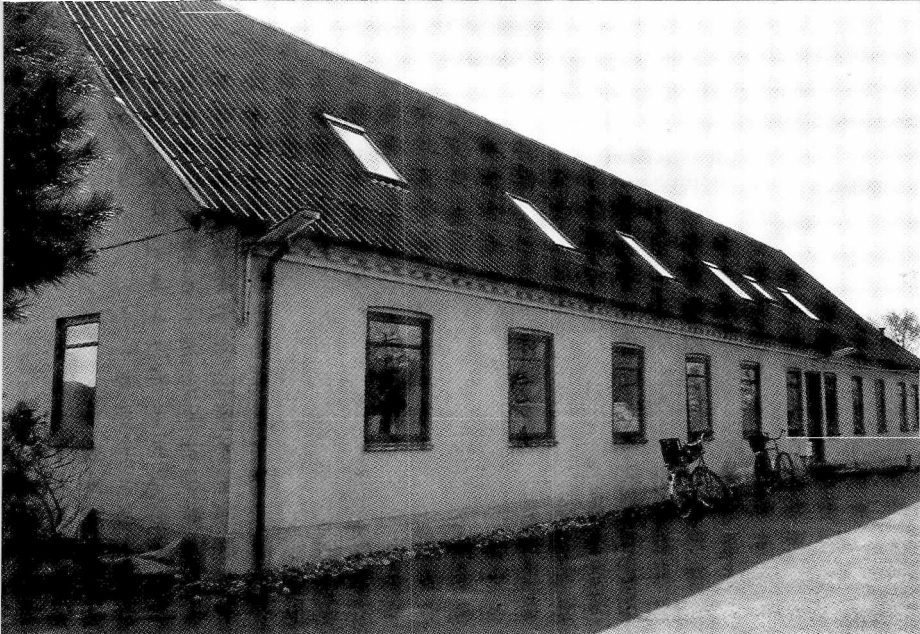
Blandt de fynske fattiggårde kom Ringe fattiggård til at indtage en særstilling, idet den ofte blev taget som forbillede, når andre fynske sognekommuner opførte fattiggårde. Billedet viser stuehuset på Ringe fattiggård anno 1989.