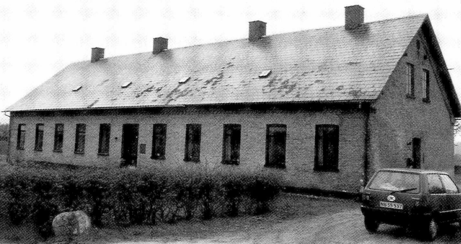
Af de nye bygninger, der opførtes efter branden på Hårby fattiggård i 1885, er kun stuehuset bevaret til i dag. Bygningen er i sin byggestil typisk for de fynske fattiggårde.