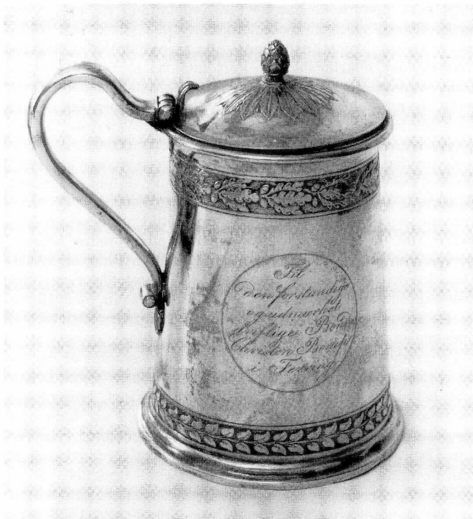
Fig. 6. Bæger tildelt som 1. præmie 1825, udført af Poul Resen Eggersen. I Lemvig museum.

Teorien bekræftes af et andet »1. bæger« fra 1825, som findes i Lemvig museum (fig. 6). 30