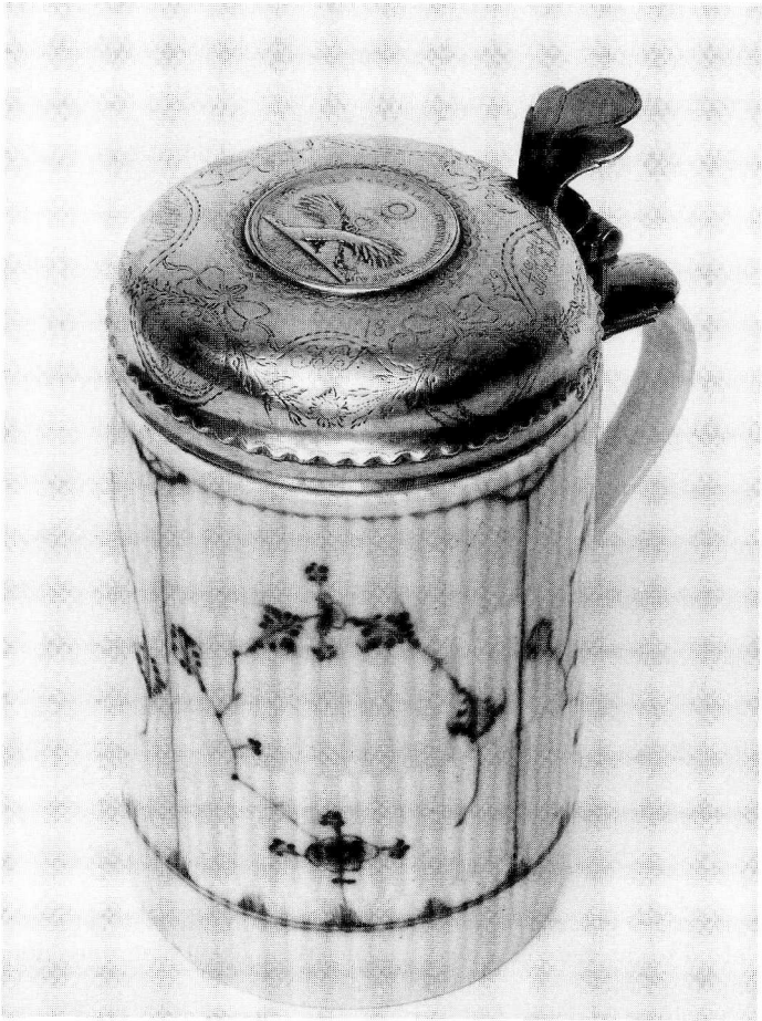
Fig. 8. Musselmalet krus med søvlåg, hvori indfældet en af Landhusholdningsselskabets medaljer.

er lavet af sølv, og midt i det er Landhusholdningsselskabets sølvmedalje indfældet, således at man på undersiden af låget læser følgende versalindskrift: »Beviis paa en god Borgers udviiste patriotiske Fliid«; på oversiden, der var medaljens forside står langs randen: »Det Kongelige danske Landhuus-