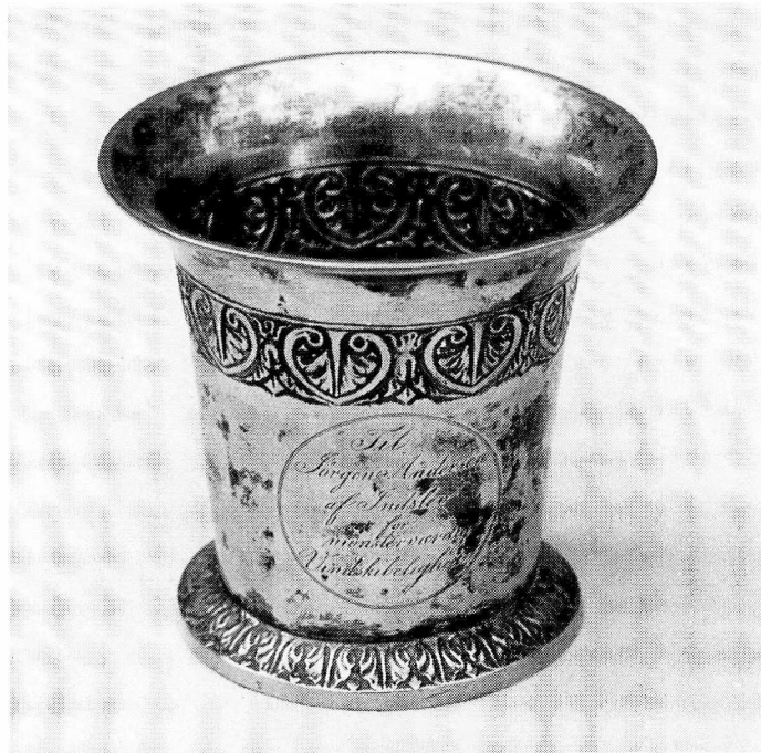
Fig. 7. Bæger udført af Poul Resen Eggersen 1836, dvs. efter den egentlig præmieperiodes ophør.

bortset fra borternes mønster. 33 Af det kendte materiale ser det ud til, at disse er blevet ændret hvert år på bægrene i den yngste gruppe.