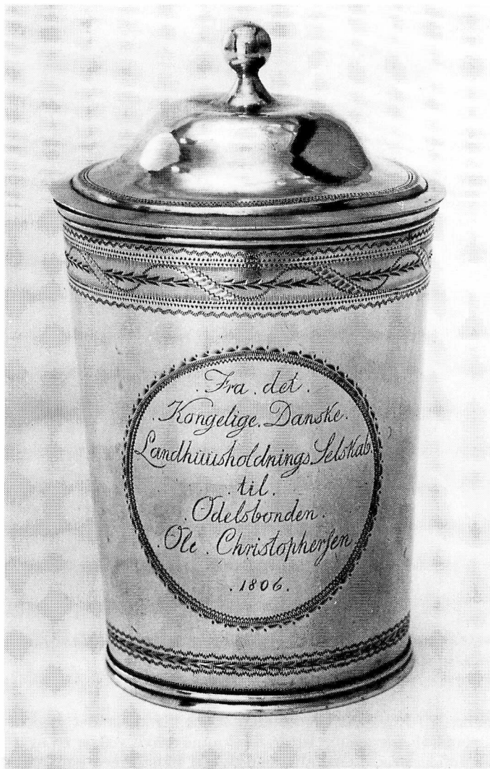
Fig. 3. Bæger udført af Lorentz Christophersen Linde 1806.