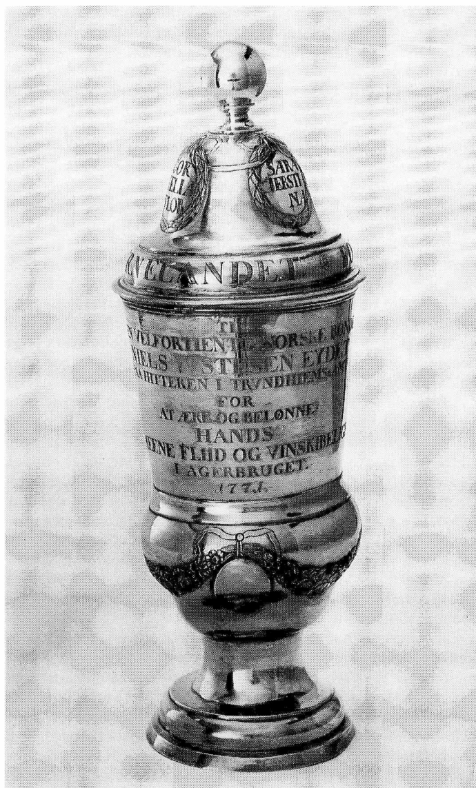
Fig. 1. Pokal 1771.