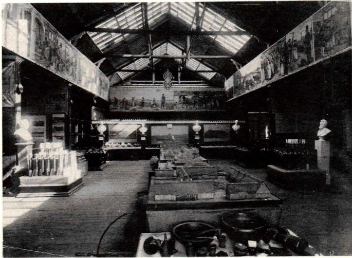
Fig. 2. Landbrugsmuseets første udstilling i træbygningen ved landbrugsskolen i Lyngby var suppleret med genstande fra Dansk Folkemuseum, bl.a. bylavssagerne i forgrunden. Husmodellerne midt på gulvet var fra udstillingen i 1888, og det samme gælder gibsbusterne af landbrugets koryfæer. Billedfrisen af gamle arbejdsmåder og folkeskikke var udført af Rasmus Christiansen til Odense-udstillingen år 1900.

Da udstillingskomiteen i august 1886 første gang trådte offentligt frem, fastslog den, at såfremt udstillingen gav økonomisk overskud, »vil dette i sin helhed blive anvendt til grundlæggelse af offentlige samlinger til fremme af industri og