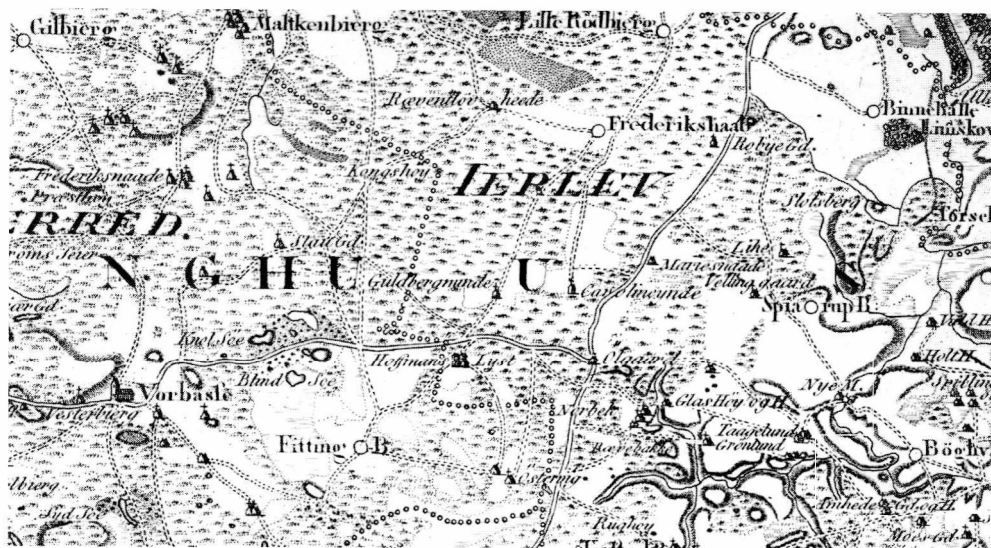
Området omkring Randbøl Hede nordøst for Vorbasse, fra Videnskabernes Selskabs Kort 1804