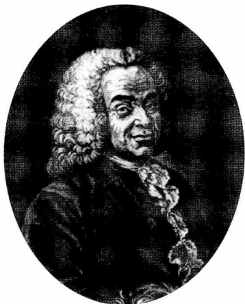
Francois Quesnay, 1694-1774. Den franske læges beskrivelse af set økonomiske kredsløb blev grundlæggende for fysiokraternes lærersystem.