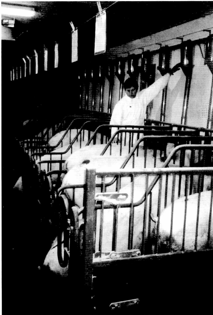
Fig. 2. Staldsystemerne er blevet mere og mere effektive og mindre og mindre arbejdskrævende. Her ses en drægtighedsstald bygget i 1998. Inventaret er imidlertid allerede »umoderne« da sådanne bokse til søer sandsynligvis bliver forbudt i de kommende år. Nye love på grund af ændrede holdninger til dyrevelfærd er én af grundene til at landmænd konstant må tænke i ændringer og nyinvesteringer. Fremtidens søer skal gå i løsdrift.

landbrug under med det formål at kunne fortsætte sin livsform.