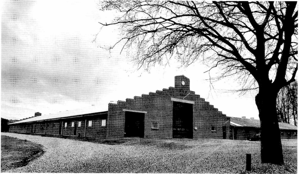
Fig. 5. Det stærkt differentierede landbrug og de meget forskellige vilkår der produceres under giver grobund for stereotype forestillinger indbyrdes mellem landbrugerne. Svineproducenterne bedømmes ofte af andre landbrugere som de mest »kapitalistiske« en bedømmelse der følger af at svineproducenter har større udsving i indtjeningen end mælke- og planteproducenter pga. karakteren af markedet for svinekød. Mytedannelsen får næring ved synet af en nybygget svinestald som denne, der giver mindelser om fortidens herregårdsbyggeri.

ve fordomme og stereotypier internt i landbruget som udtryk for, at her dybest set er tale om en og samme kultur, men hvor forskellige specialiseringer indenfor denne kultur, på grund af de strukturelle forandringer, i dag eksisterer under forskellige betingelser. Svineproducenter, mælkeproducenter og planteavlere er alle et led i en dansk landbrugertradition som gennem de seneste årtier har været under et ret så stærkt pres for