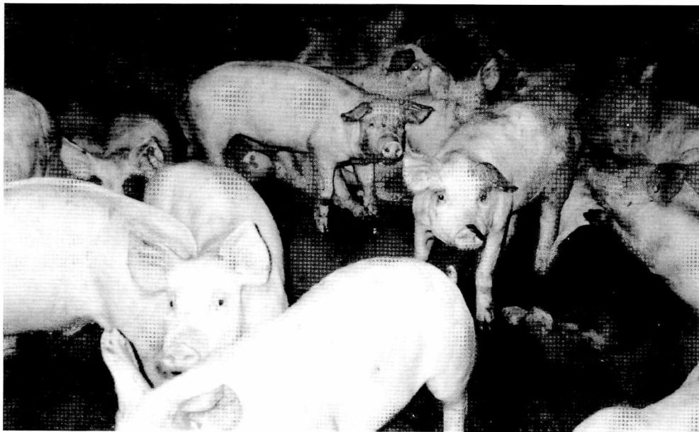
Fig. 4. Kravet om effektivisering og forøgelse af produktionen har siden 1960'erne betydet en stadigt mere omfattende specialisering indenfor én af produktionsgrenene: I den almindelige terminologi er en landmand nu enten svine-, mælke-, kyllinge- eller planteproducent, også selv om det trods alt stadig er det almindeligste at husdyrproducenterne tillige dyrker de omkringliggende marker.

lade være. Citatet viser blot en af mange måder hvorpå man kan udtrykke en afstandtagen til hinanden.