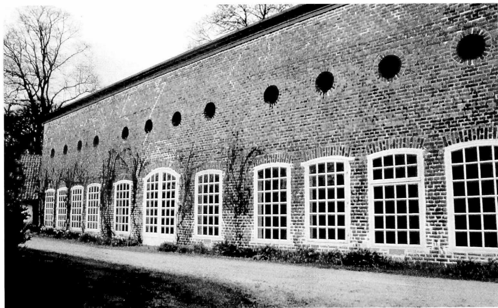
Figur 5. Till trädgårdsmästarens uppgifter hörde att sköta de exotiska växterna i de nya anläggningarna, orangerierna. Bilden visar det nyligen renoverade orangeriet vid Övedskloster.

ligt. Hur de olika ledarskapskulturer påverkade det sociala klimatet är ännu en relativt outforskad frågeställning.