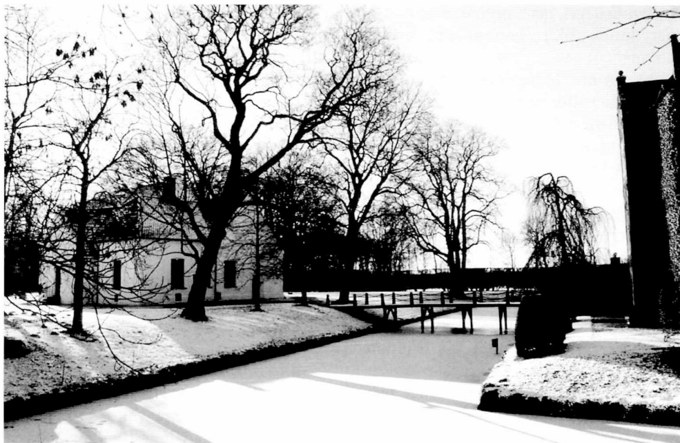
Figur 2. Patronatskyrkan vid Trolle-Ljungby ligger näst indtill vägg i vägg med huvudbyggnaden.

av förvaltning och ledarskap som började att praktiseras. För baltiska och litauiska gods har godsförvaltning genom instruktioner av olika slag påtalats. 16 Dessutom har förvaltarskap setts som en del av utvecklandet av en webersk byråkratisk förvaltnings »kanon«. 17 I den tyska debatten har olika slag av ledarskap i termer av närvarande respektive frånvarande godsherrskap analyserats. Det har påvisats att även den ofta frånvarande godsherren strävade efter en noggrann kontroll över sina underlydande. Husordningen skulle vara lika god oavsett om