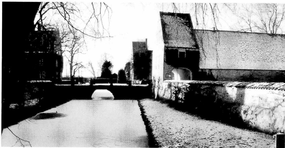
Figur 4. Porthus vid Trolle-Ljungby. Distans markerades ofta med fysiska medel genom klaffbroar och vallgravar. Porthus och vallgrav fungerar här både fysiskt och socialt åtskiljade. Hit men icke längre.

Höök som ersättning för dennes expenser i samband med tingsförhandlingarna. 22 Under 1700-talet blev det allt vanligare att anställa särskilda »skogvaktare« som fick i uppdrag att skydda skogar och utmarker mot olovligt nyttjande av olika slag. Skogvaktaren gjordes ansvarig för åverkan och skador på skogen, och i skogvaktarkontrakten anges skyldigheter som att själv erlægga böterna om inte skogstjuvarna kan gripas. Skogvaktare Sven Hansson skyldigheter formuleras i kontraktet på följande sätt: