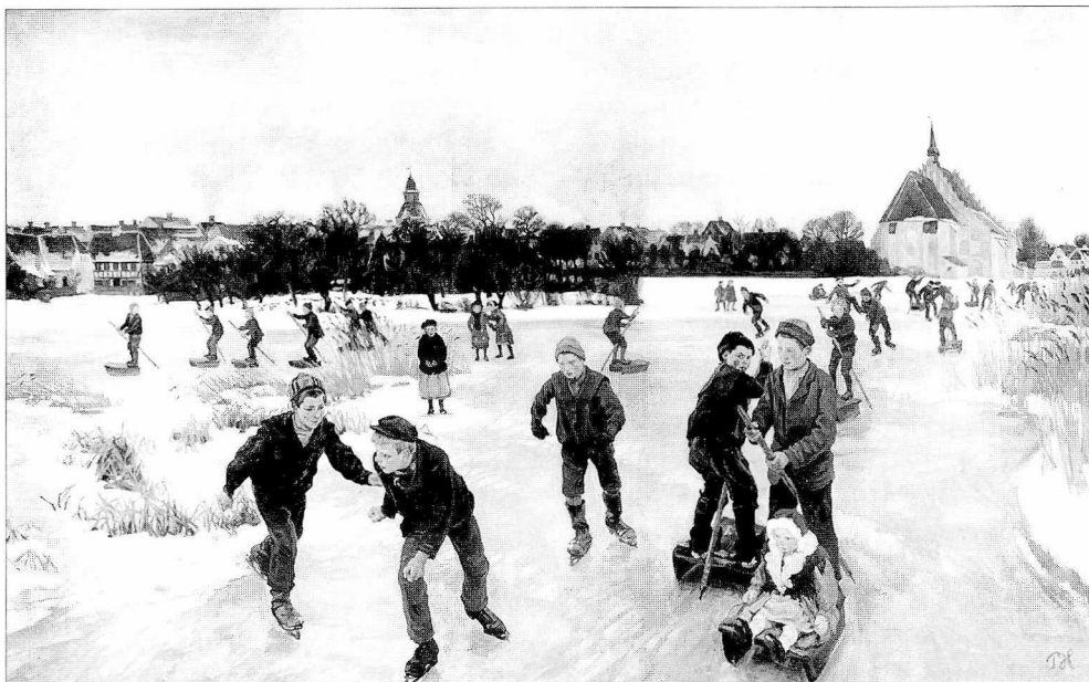
Maleri af Peter Hansen: På isen bag byen, Fåborg, 1901. Nogle af børnene løber på skøjter, men de fleste står på isslæde med en pigkæp til at stage sig frem med. (Statens Museum for Kunst).

Nå, køre rundt, jo, men det havde vi nu itte så meget med ... Men vi kørte nærmest på slæde, og så sommetider så huggede de jo så et stykke af isen og så rendte vi på gynger dér, for dernede på maden der var jo altså itte så