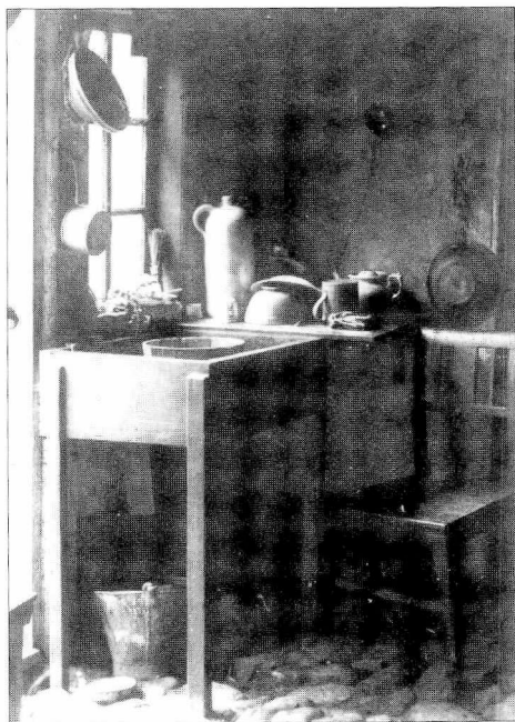
Køkken i Munkebo 1889. (Foto: Lars Rastrup. Efter Erland Porsmose: Naturens sang – Menneskets kår , 1989, s. 50).

Eller óg jeg sov videre, hvis jeg blev liggende i sengen. Og vi havde og sådan en gammel foderseng 3 at ligge i, jo. Der var jo da en nat, da havde mor ligget en rotte ihjel under sig. Der var så mange rotter og så mange mus, og jeg turde ikke ligge i sengen næsten, når at der var sådan noget skab jo.