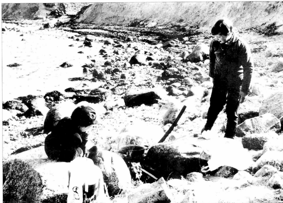
Traditionen med at koge æg på stranden til påske er bevaret helt op til nutiden. Her er det lange-landske børn der har tændt bål.

var strengt. Uha. Stå inde på sådan et mørkt lunt loft, hvor der var fuldt af spindelvæv. Åha da. Uh hvor vi døjede med varme. Ja, vi havde itte –. Dengang da havde folk ellers så meget tøj på. Men vi kunne itte bære andet [end] lige bukserne og det måtte næsten ingen mennesker se. Det må de da gerne se nu. Nej, nej, det var –. Uha det var en hel skam, hvis nu der så kom nogen til gårde, og vi skulle ud – et af os skulle ned og hente noget at drikke, at itte så de så det. Ja, tøs du kunne da også have ventet, til de