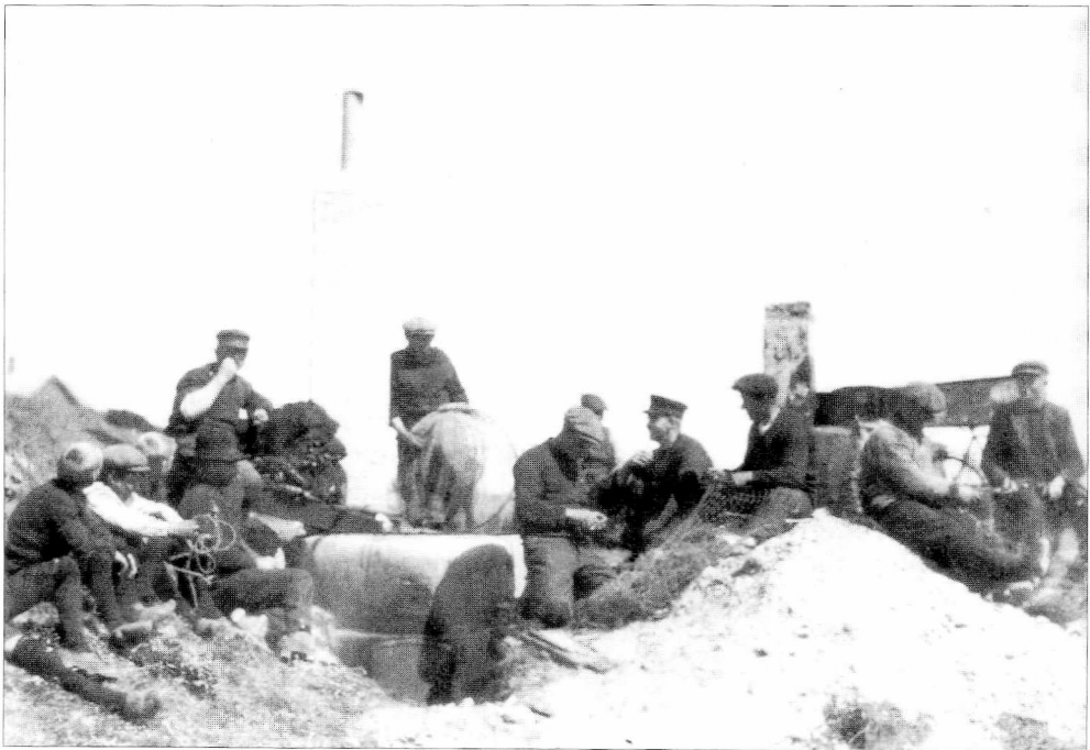
Fiskere bøder og tjærer garn med tre drenge som ivrige tilskuere, en af dem med rusebøjler. Måske hans egne? (Foto: Lars Rastrup. Efter Erland Porsmose: Naturens sang – Menneskets kår , 1989, s. 118).

forstår du. Så siger jeg til vor far, “Må jeg itte sætte en rejeruse ud?” “Jo”, sagde han. “Det må du godt”, sagde han. “Men pas nu på, itte at du ligger og kommer galt afsted og hopper ud af prammen”. “Nej. Det går nok”, sagde jeg. Og den satte jeg omme i Mejlhoveder, den her ruse. Og ved du så hvad fangst jeg havde? Jeg havde to store blankål i den. Det var al min fangst. Rejer var der itte noget af. Ja, tænkte jeg ved mig selv, når at den kunne fange to blankål, så må der vist være blankål, når den tid kommer. Så bandt jeg fire ruser og satte