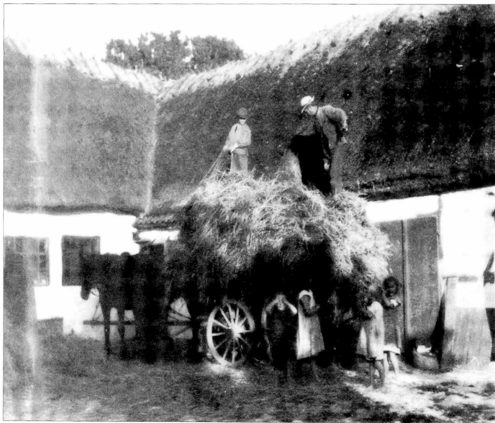
Der køres korn ind med en dreng ved tømmerne. (Foto: Lars Rastrup. Efter Erland Porsmose: Naturrens sang – Menneskets kår , 1989, s. 95).

mand at gå derude, for vi havde da ligegodt en tyve køer og en syv-otte ungdreager. Der har vel nok været mellem femogtyve og tredive dreager kunne vi godt sige der var. Og man skulle gå og passe på at inte de løb nogen steder uden de blev på marken. For dengang havde de ingen roer på den gård, men der var en nabo, han havde roer. Og det var sgu ikke sjovt at