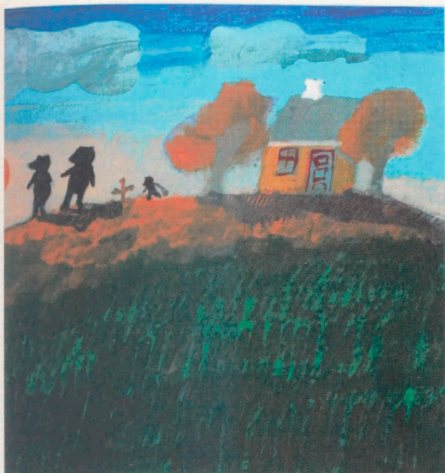
ILLUSTRATION THOMAS WINDING