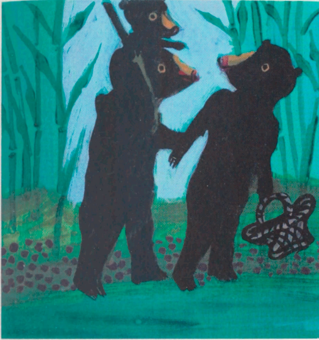
ILLUSTRATION THOMAS WINDING