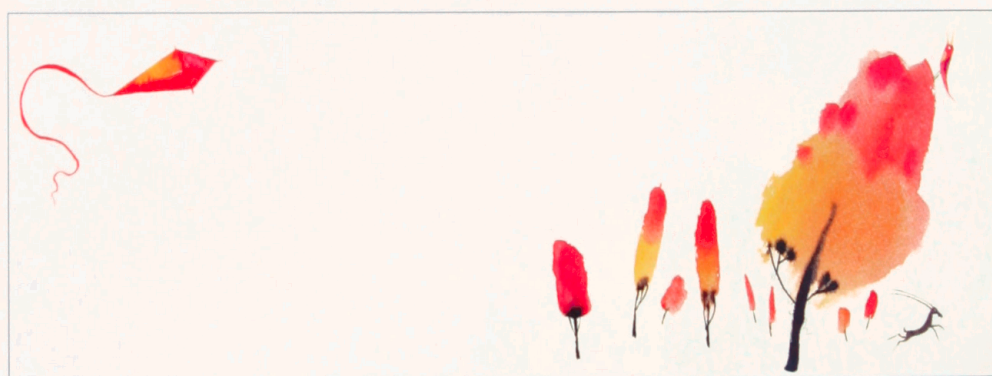
Guldæble til Piet Grobler, Sydafrika