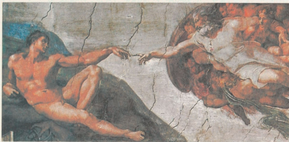
Adams skabelse. Fragment af loftet i Det Sixtinske Kapel, Peterskirken. Michelangelo, 1508–12.