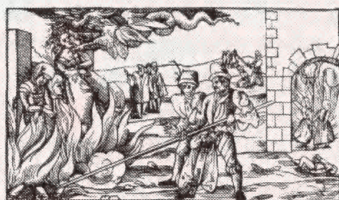
Hekseprocesser. Transir fra børening om offentlig brænding af tre hekse i Derneburg (Hartz), oktober 1555

helium: grundstof; opstår ved de radioaktive omændelser, ved hvil-