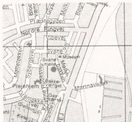
Københavns-kortet. Kortinddeling. Hel størrelse.