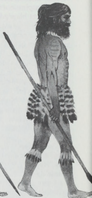
Cro-Magnon, det første menneske, som skabte billedkunst.