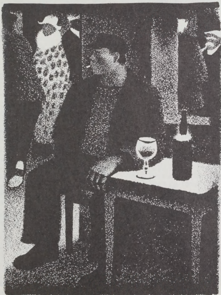
Sikker Hansens svar på den bundne opgave fra 1934. Se p. 82 og 84.

Sikker Hansen lod sig ikke nøje med en plads på væggen. Han ville nok helst illustrere, hvad han havde gjort i så mange år, fortrinsvis i Magasinet, men også i bøger af og til. Under besættelsen fik han illustreret sit livs bog, Johannes V. Jensen: Kongens Fald (1944), hvis der med et sådant begreb menes gendigtning, tekstuddybende begejstring. Det siges, at Johannes V. Jensen, som ved adskillige lejligheder havde ladet Sikker Hansen akkompagnere sine tekster, blev utrolig bevæget af at se sin