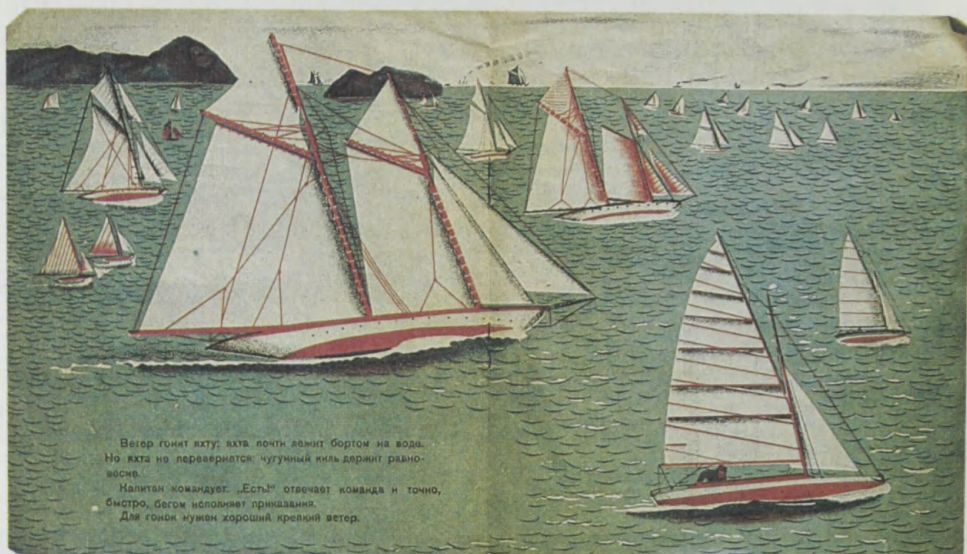
Opslag fra sovjetisk børnebog 1932. Inspiration for danske tegnere.