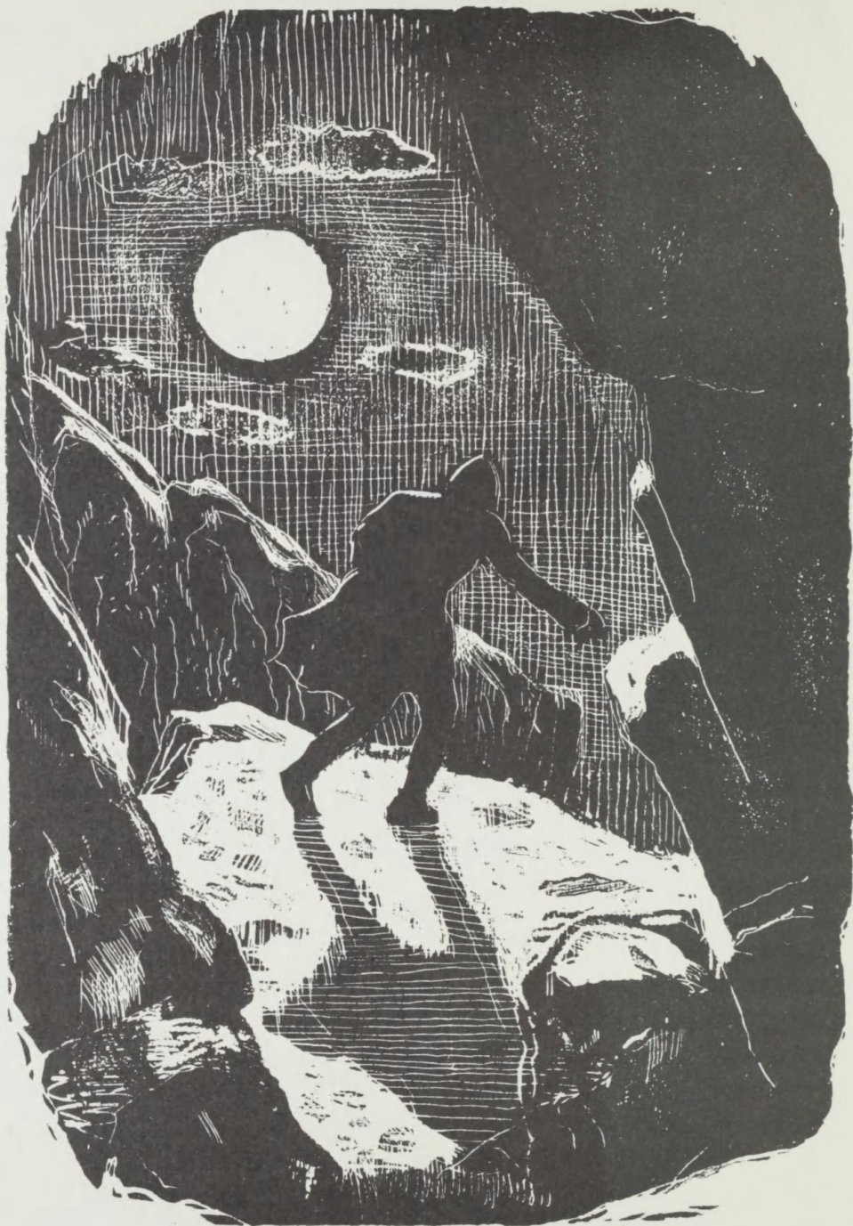
Frontispice: Illustration til 'Drømmekvadet'. Reliefætsning af Povl Christensen. 1961.