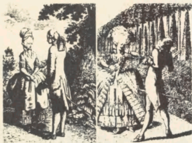
Daniel Chodowiecki: Konversation

Munksgaards udenlandske antologier er et fint eksempel på »den nye skolebog«, her for gymnasier og seminarer, Tysk antologi , 230/150 mm, 1982.