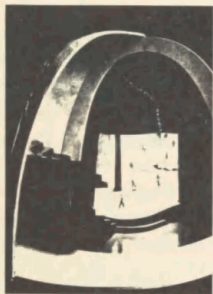
EXPERIMENT THEATER MODEL, 1932

Helge Refn er på denne udstilling først og fremmest præsenteret ved plakater og omslag. Et veloplagt lille bogarbejde er dog også med, Kunstindustrimuseets katalog Helge Refn 72 , 270/210 mm, 1972.