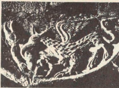
Detalje af kættil i skulpturen i Sæunge (Hornø) Billedværk. Kættil i Trone-marken, Sæunge. Frøskovs jorl. Sørensen. Lidemåstret tegning (Dithmarsche, Grafeld 7) (Hornø)

50 år senere tilhænger Nibelungenlied sin Dietrich en hustru ved navn Herrad, sagans Herrad. Og midt i en oprindelse af farvebaserede bøger nævner sagens Sintram (I, 33, kap. 26) som navn på den person der senere (I, 196-201, kap. 189-93) er ved at blive slugt af dragen. Ahla i den mest dramatiske scene setop i Andlau.