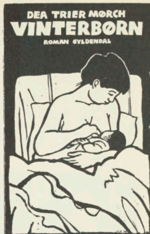
Omslag, Dea Trier Mørch, 1977, Gyldendal, i.u.

Illustration: Forfatteren . Forlag: Kunstindustrimuse-et (1972) . Tilrettelægning: Jens-Peder Jacobsen , Helge Refn og Eva Steinaa . Bogtryk: NC Trykkeriet . Klichéer: Aktuel Kliché Service .