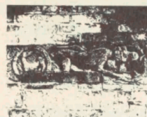
Detalje af hestekølle fra Middelalderen, Aulde, Frøskov jorl. Sørensen. Billedværk. Munko Kælle, hvor Lohng herred. Rander omme side 158 til højre