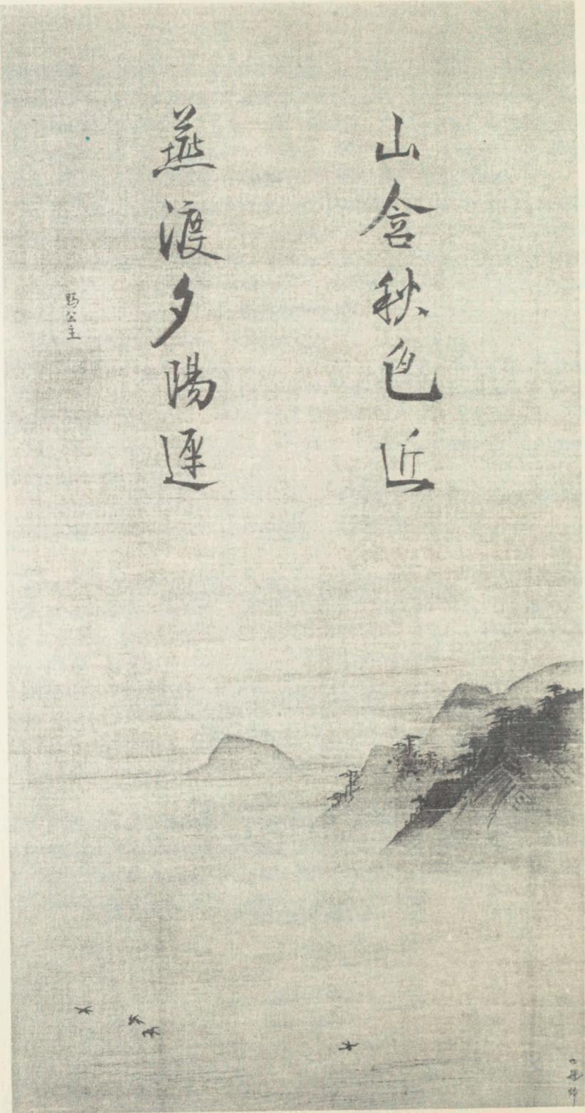
Ma Lin: 'Solnedgang'. Tusch, ca. 1250. Kina, Sung-perioden.