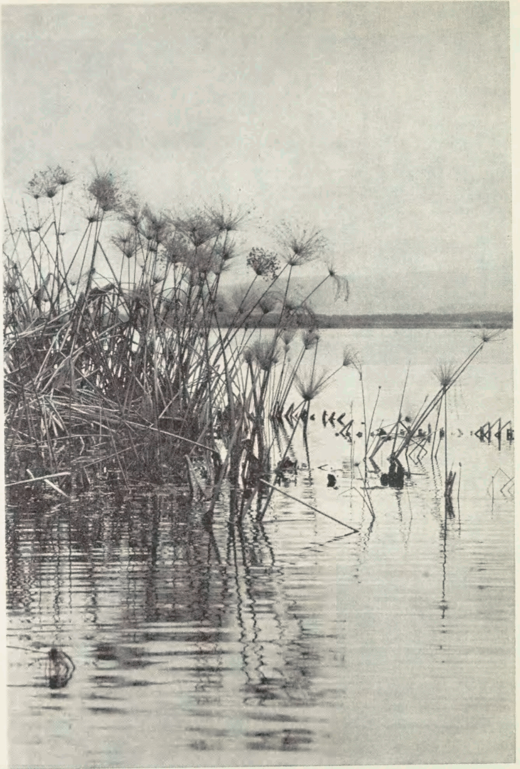
Papyrusplanter. Lake Naivasha, ca. 100 km NV for Nairobi.