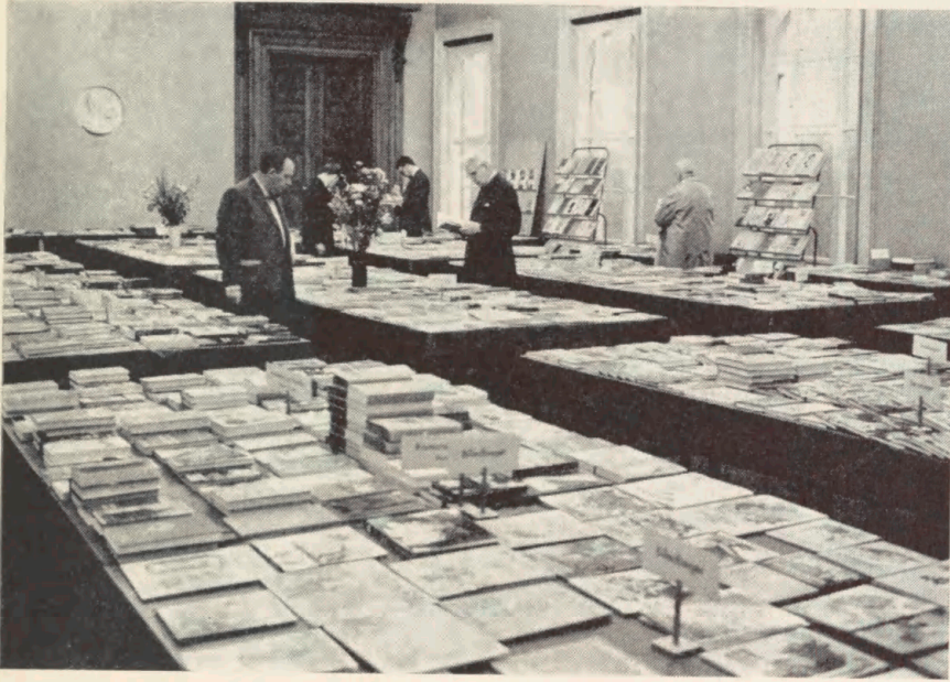
Fra udstillingen Dansk bogproduktion 1964 på Kunsthåndværkerskolen i København.