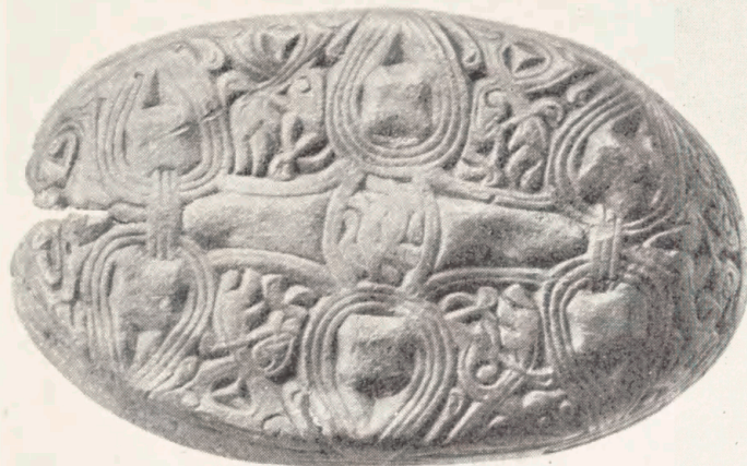
2. Skålformet spænde fremstillet af en engelsk kunstner. Smykkeformen er skandinavisk. Ornamentikken engelsk. Ca. hel størrelse.

var selvfølgelig Sct. Peters grav besøgt, som det stadig er tilfældet. Det er naturligt, at denne tro måtte afføde handel med relikvier. Hvilken fortjeneste indlagde man sig ikke ved at hjembringe rester af de helliges jordiske levninger. Derved gav man jo også de mennesker, der ikke havde råd eller lejlighed til at drage til Rom, mulighed for alligevel at få kontakt med helligdommen. Og relikvierne måtte selvfølgelig transporteres på værdig vis, i små smukke skrin.