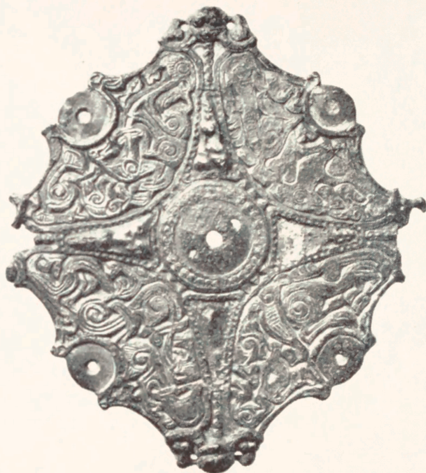
8. Beslag af forgyldt bronze. Ornamentikken er en hjemlig variant af missionsstilen. På de fire spidser har dog været gribedyr, der griber sig selv i ørerne (afbrudte på spidserne til højre og til venstre). Ca. hel størrelse.

rektangulære plader fra småskrinene. Missionsstilen trængte også ind på de almindelige smykkeformer, hvad der hidtil har været ret upåagtet. En almindelig smykkeform er det skålformede spænde fig. 6, karakteristisk for vikingetidens begyndelse. Set ovenfra minder det om et firfodet dyr. De runde flader har haft en belægning af en eller anden slags, som har siddet fast med de små tappe, der er tilbage. De har markeret benene. Ryglinjen har ligeledes haft en belægning, der nu er forsvundet. Siderne er fyldte med linier, der tilsyneladende er noget forvirret kramskrams. Men i virkeligheden danner de en hel række fanta-