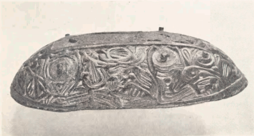
6. Skålformet spænde fra vikingetidens begyndelse. Hovedlinierne danner et firefodet fantasidyr. – Ind imellem ligger andre dyrefigurer, der er inspirerede af missionsstilen (se fig. 7). Ca. hel størrelse.