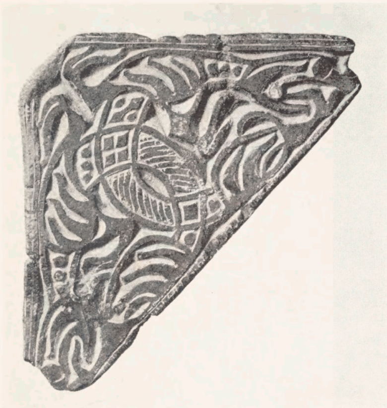
3. Hjørnebeslag til bogbind fundet ved Roskilde. Dyrefigurernes hoveder ses tydeligt i vinklerne ved trekantens grundlinie. Dobbelt størrelse.

Alene et sådant halsbånd er en levende illustration til det internationale tilsnit, der har været over det daglige liv i vikingetiden. Den kvinde, der lå begravet her, må have været svensk efter gravgodset at dømme. Der fandtes de karakteristiske skålformede spænder. Hun havde kniv og sax med sig foruden andet absolut hedensk gravgods. Hermed passer det jo også meget godt, at beslaget er revet af den hellegelige bog, forsynet med øsken og derefter indlemmet i den pyntesyge dames halsbånd. I virkeligheden er der intet i vejen for, at det lille bogbinds-beslag kan have siddet på en af de bøger, som Ansgar mistede på vejen til Birka. Tidsmæssigt passer det i hvert fald storartet.