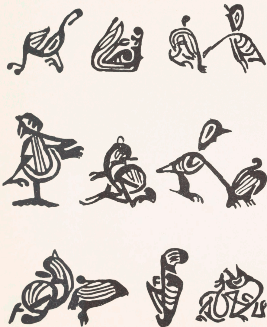
7. Dyr i skandinavisk præget missionsstil. Nr. 9 er omtrent identisk med dyr på Tassilo-kalken. Det er disse dyr, der danner ornamentikken på spændet fig. 6.