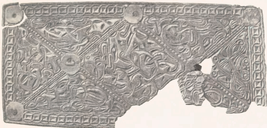
1. Beslag til et skrin, senere omdannet til spænde. Ren nordisk ornamentik ses kun i det trekantede felt til højre. Ca. 2/3 størrelse.

rettet til at støbe to små kors og en Thorshammer på een gang. Det synes i hvert fald at vise, at den har tilhørt en guldsmed, der var om sig. Han kunde betjene kunder fra begge lejre. Så fredeligt er det gået til ved kristendommens indførelse, og så langsomt er det gået for sig. Den omtalte støbeform er fra det 10. århundrede og det er jo også først i dette sekels slutning, at Harald Blåtand »gør Danerne kristne«. At det så nok tog endnu længere tid, inden den nye tro helt havde vundet fodfæste, er ganske givet. Der er gået et par generationer.