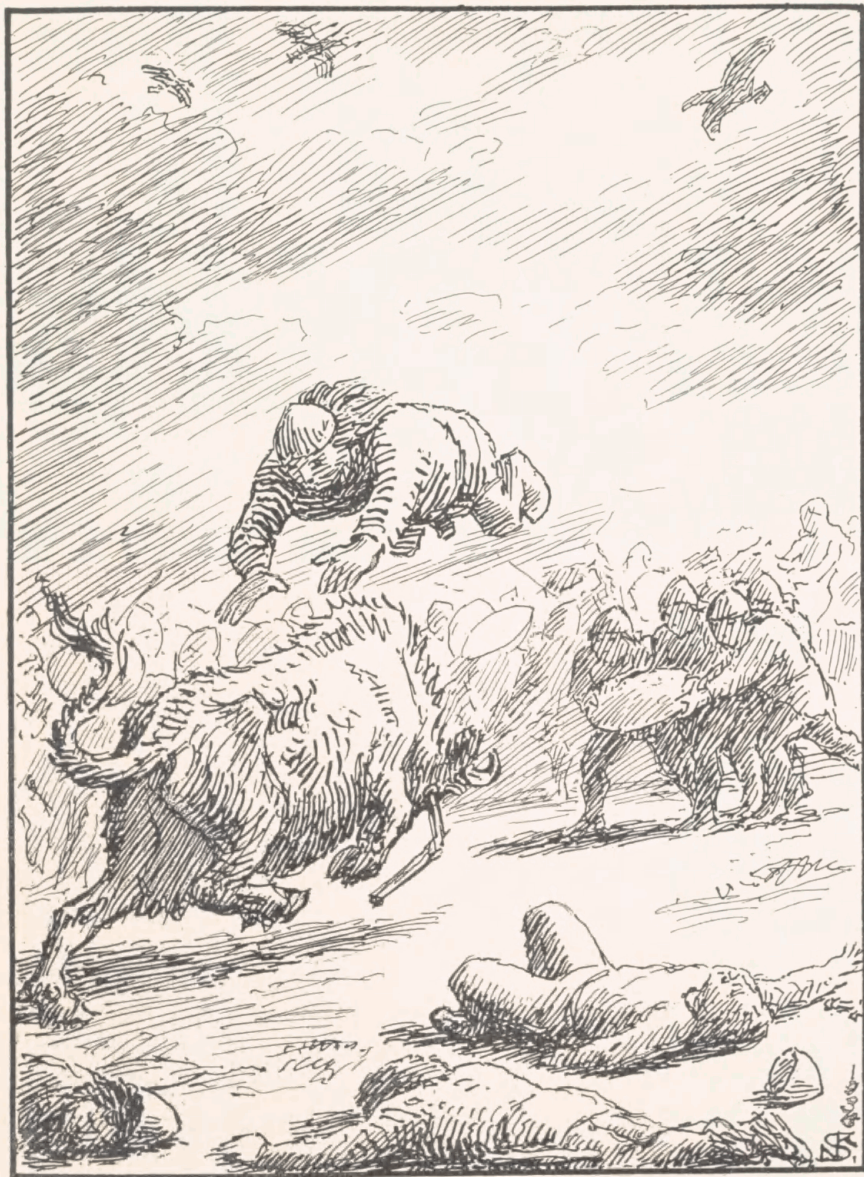
Ivars Kamp med Trolldkoen Sibilja. (Efter Regnar Lodbrogs Saga, 1935)