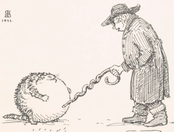
Illustration fra Eventyret »Den tykke Kat«.

De tre her gengivne Billeder stammer fra »Danske Sagn og Eventyr fra Folkemunde«. Ved Axel Olrik. Udgivet af Foreningen »Fremtiden«, 1.-3. Samling, 1913-23, 4. Samling 1929.