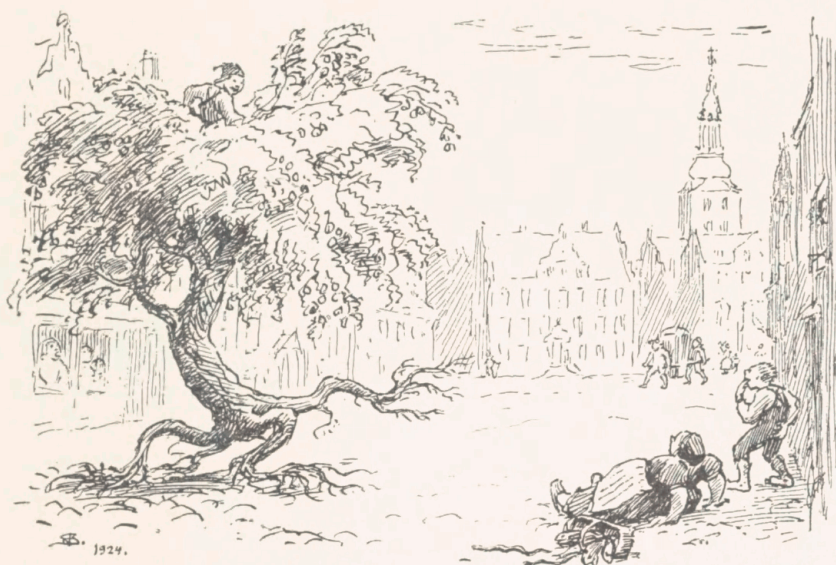
Illustration fra Eventyret »Lad Kalling-Søn«.