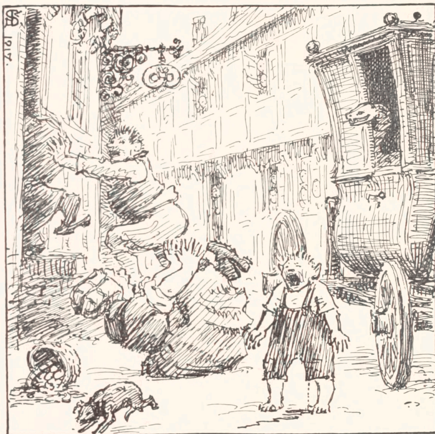
Illustration fra Eventyret »Vildering Kongesøn og Miseri Mø«.