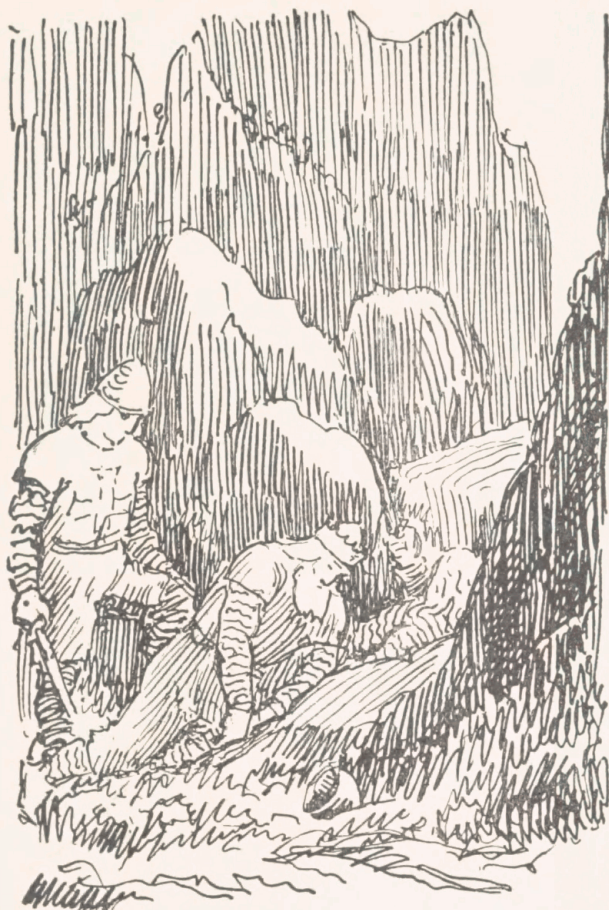
Kejser Karl finder Rolands Lig i Kløften ved Ronceval. (Hidtil ikke offentliggjort Tegning)