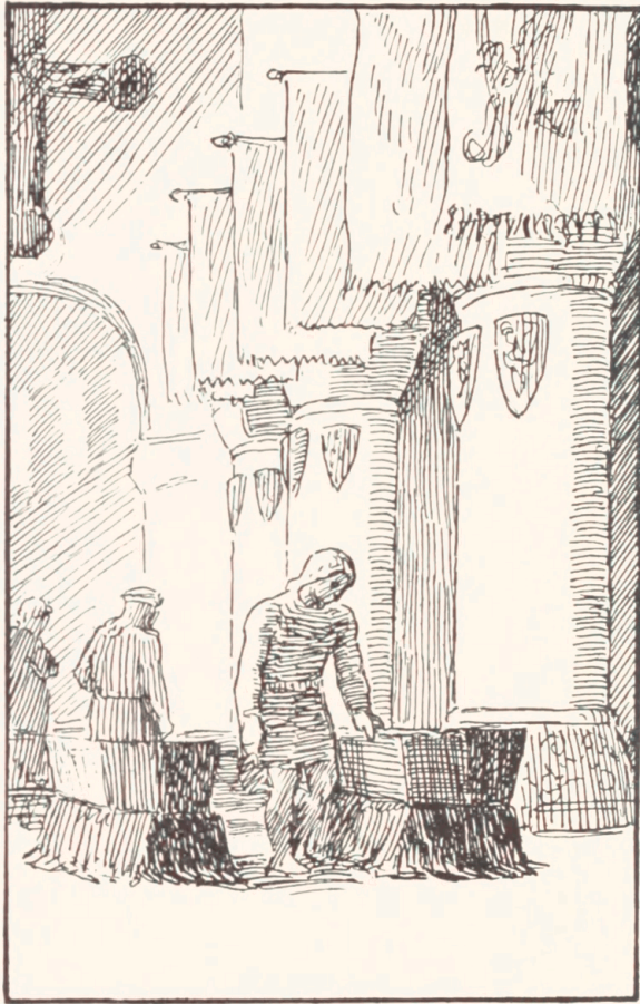
Kejser Karl og Holger Danske ved de tolv Jävningers Kister. (Hidtil ikke offentliggjort Tegning)

Hær er draget uden om Kløften. Roland kalder tre Gange i sit Horn Olifant, og Kejseren kommer til Undsætning, men for sent. De er alle døde, og ved Synet af Rolands Lig segner Kejseren om, medens Holger stivnet sværger Hævn. Højt oppe i Fjeldet skimtes de bortlistende Maurere, som har været beskæftiget med at nedstyre Ste og Klippeblokke.