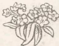
Niels Skovgaards Titelbillede til andet Bind af »Sønderjylland«, 1919.

MAGNUS, TVENDE RIGERS PRYD, IHNDE GUD DIN KONGESJÆL AT SE NORDENS GRÆNSEPÆL ATTER RYKKET FREM MOD SYD.