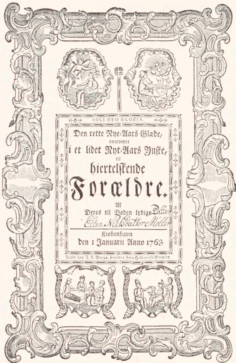
Nytårsdigt med titel i rokokoramme og med indskrevet navn. (Tilhører Nationalmuseet).