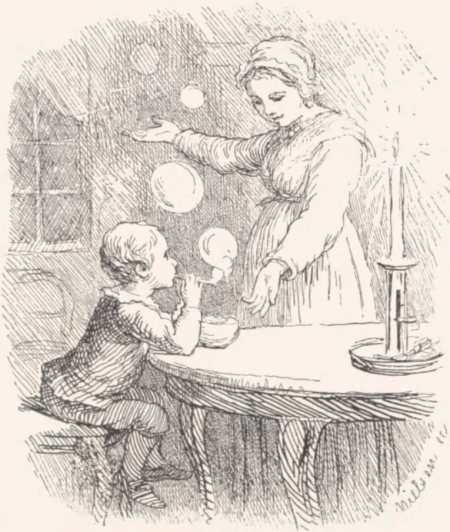
Den lille Dreng og hans Moder fra Eventyret „Kometen“. Ætset af J. C. Nielsen til „Nye Eventyr og Historier“ 3. Bd. 1874.