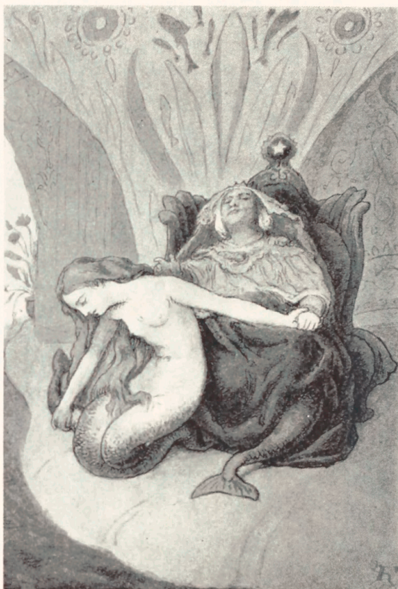
„Vi har det meget lykkeligere og bedre end Menneskene deroppe“. Tegning fra Udgaven af tre af Eventyrene 1905.