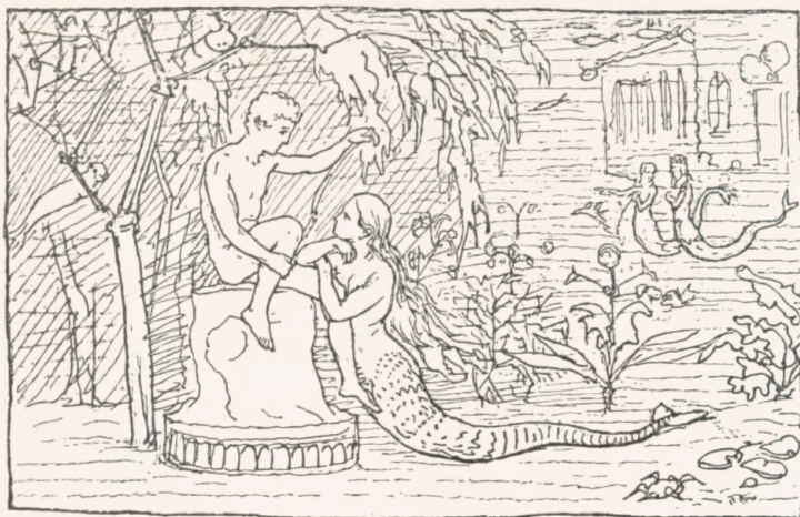
„En smuk Marmorstøtte, en dejlig Dreng var det, bugget ud af den hvide, klare Sten og ved Stranding kommen ned paa Havbunden“.

ved den Metode, han benyttede til Reproduktion, idet han i de fleste Tilfælde selv raderede Tegningerne paa en Zinkplade, som derefter blev omsat til Højætsning.