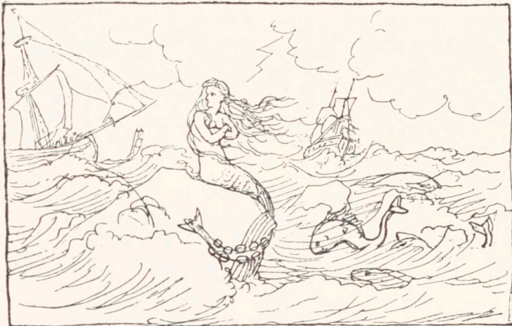
„Hun havde sat sig paa et af de største Isbjerge, og alle Sejlere krydser forskrækkede uden om, hvor hun sad og lod Blæsten flyve med sit lange Haar.“

af H. C. Andersens Eventyr med 15 Eventyr og 52 Billeder, kom Kritikken frem, og heller ikke de følgende Bind fra 1870, 1871 og 1874 vandt det Bifald, man kunde have ventet. Uvilkaarligt sammenlignede man ham med Forgængeren og fandt, at Vilhelm Pedersen havde langt mere af Andersens Aand og Tone. Skønt Frølich utvivlsomt var en større Kunstner end Pedersen, syntes man, at hans Tegninger var for fantastiske og satiriske, for meget præget af hans mangeaarige Ophold i Tyskland og Frankrig, og især de voksne Personer i Billederne, syntes man, havde i for høj Grad et fremmed Tilsnit.