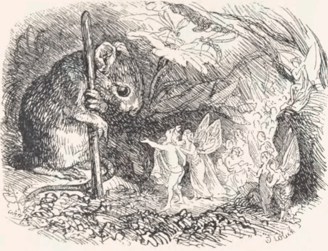
Musen med Alferne fra Eventyret „Suppe paa en Pølsepind“. Ætset af Brdr. Comte til „Femten Eventyr og Historier“ 1867.