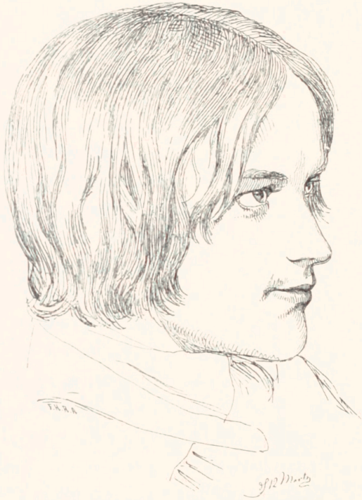
Ungdomsportrait af Lorenz Frølich. Tegnet af Job. Th. Lundbye 1837.

Den Evne for Illustrering af Fabler og Eventyr, han i saa rigt Maal besad, fik han rigtigt Brug for, da C. A. Reitzels Forlag efter