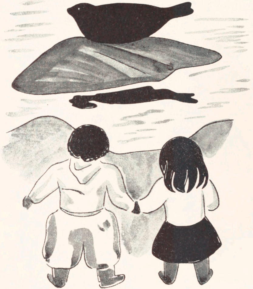
Tegning af de to Grønlander-Børn, der betragter Sælen paa sin Sten, til Børnebogen »Palo från Grönland«.

handsken, som Tor og hans Mænd ser ind i som en sort gabelende Indgang til en Hule i den haarbevoksede Fjeldside.