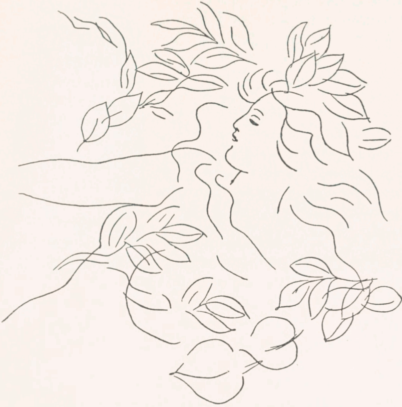
Tegning til Seedorff Pedersens Digt »Pigens Møde med Pan«.

Plæne skildredes, skulde levere en Tegning af denne Situation, beklagede han ikke at kunne gøre det, da han ikke havde nogen Krage ved Haanden! Hvorpaa han fjernede sig. Et Par Timer efter kom han tilbage: nu kunde han godt paa-tage sig Tegningen, for nu havde han en død Krage under Armen! Han havde været i Frederiksberg Have, set en Krage, der svarede til Beskrivelsen og ramt den dødeligt med et velrettet Stenkast. Men hvor mange Rids af Hoved, Næb, Øjne, Kløer og Fjer skulde der ikke til, før Kragen, een for alle, stod paa det endelige Forlæg til Klichéen.