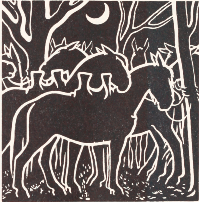
»Der bunde de deres Heste«. Tegning til Niels Ebbesen-Visen.

Der Kongen han drog af Gullands Borg, da fulgte hannem hundred Svende: og der han kom til Ringsted, da fulgte hannem ikkun Dagsmars Dreng.