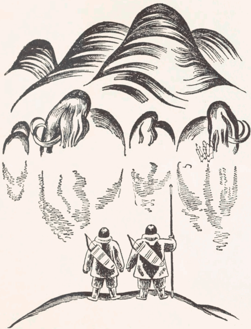
Illustration til Knud Rasmussens »Festens Gave«, hvor de to Grønlandere ser »Øernes« i Taagehavet afsløre sig som Mammuth'er.