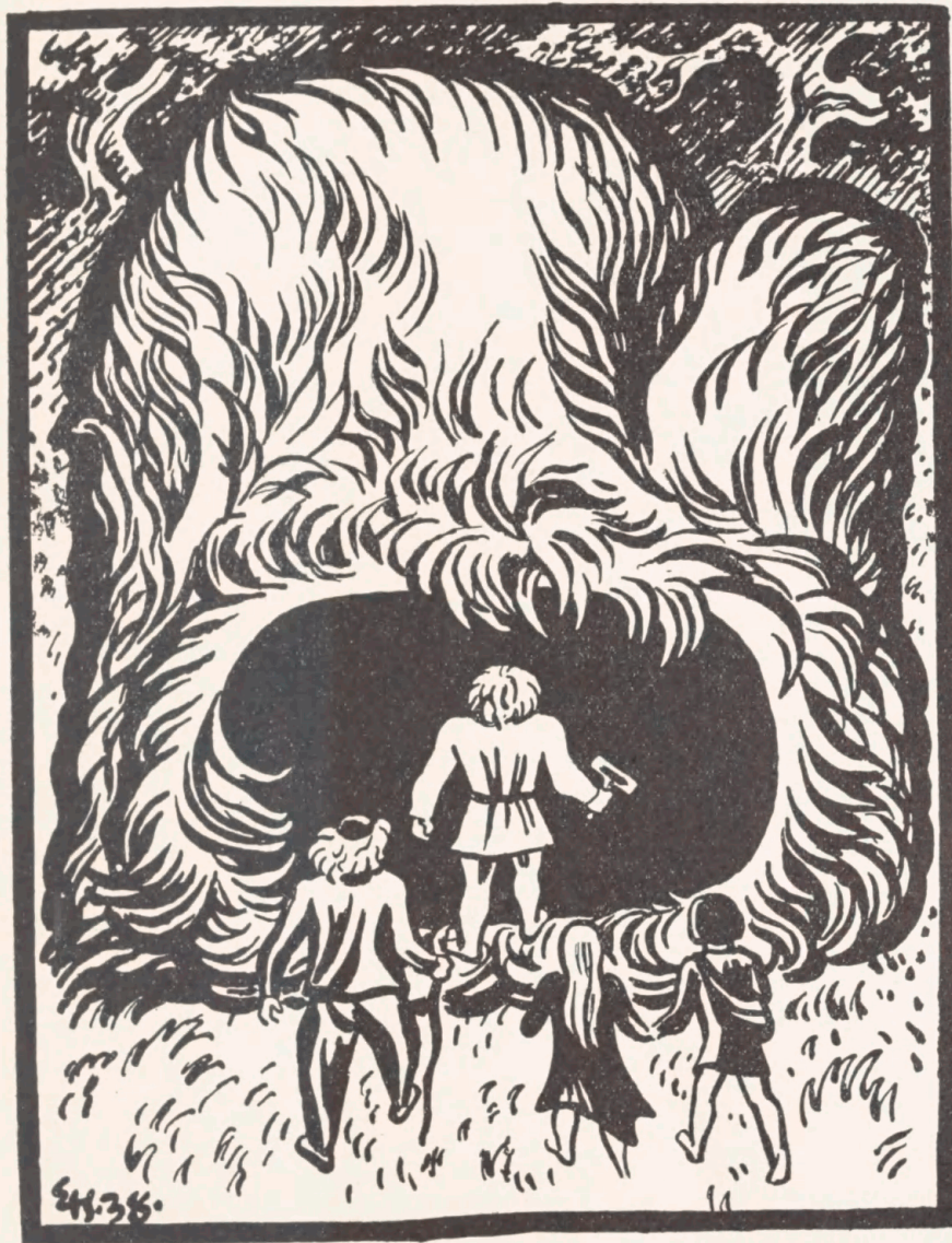
Tegning af Tor og hans Mænd foran Handsken i »Nordiske Myter og Sagn«.