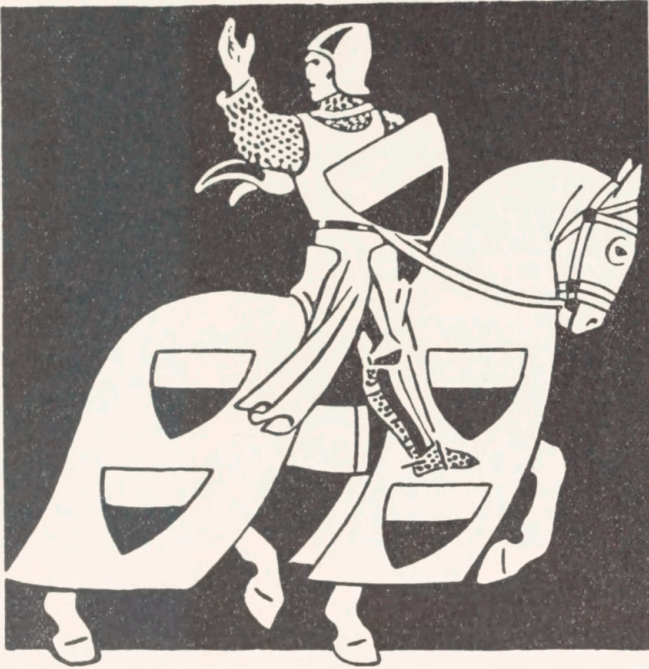
Tegning i Træsnit-Stil af Niels Ebbesen til Folkevisen.

»Jeg saa Sejl i Sunde fare...« De fremkom senere som et Hefte »Danske Fornviser«, men kun med en enkelt Folkevis-Titel eller -Linie forneden paa Siden.