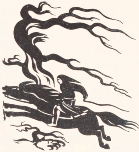
Valdemar Sejrs Ridt til Ringsted. Illustration til »Dagmarvisen« i »Danske Folkeviser«.