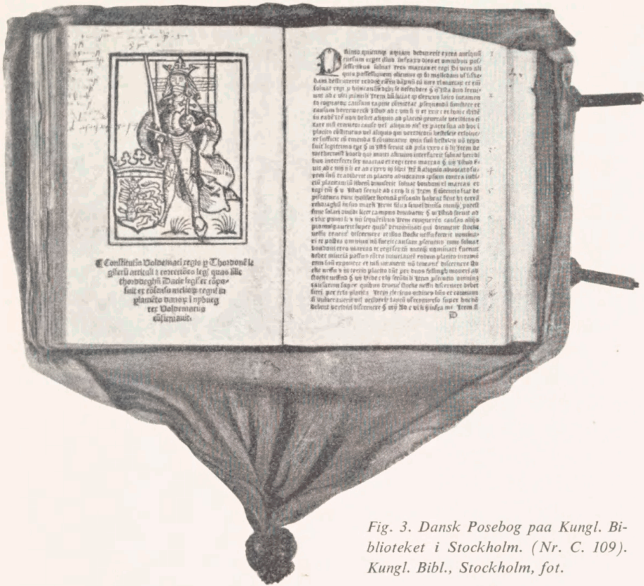
Fig. 3. Dansk Posebog paa Kungl. Biblioteket i Stockholm. (Nr. C. 109).

Kun to Posebøger er ikke af religiøs-opbyggelig Art, men rent profane. De er begge af dansk Oprindelse, ret sene og begge af strængt juridisk Indhold. Den ene findes i København, den anden i Stockholm. (Fig. 2 og 3).