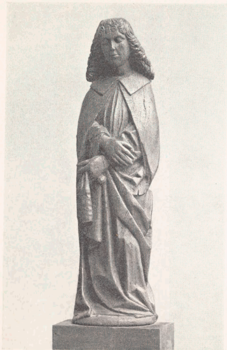
Fig. 8. Johannes Evangelist fra Boller Slot. Ca. 1490. I Forfatterens Eje.