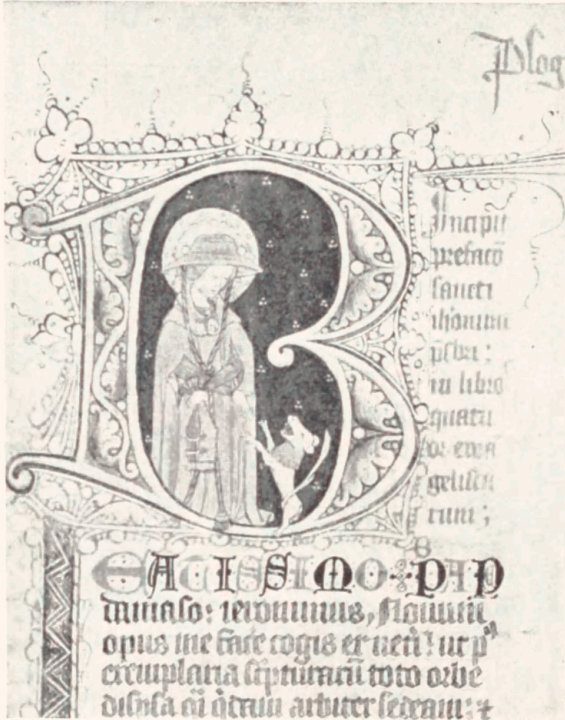
Fig. 19. Hieronymus. Initial i Pergamthaandskrift paa Det kgl. Bibliotek i København. (Thott. Nr. 3). Ca. 1408.

Fortegnelsen er ikke fuldstændig og dækker væsentlig tysk Omraade.