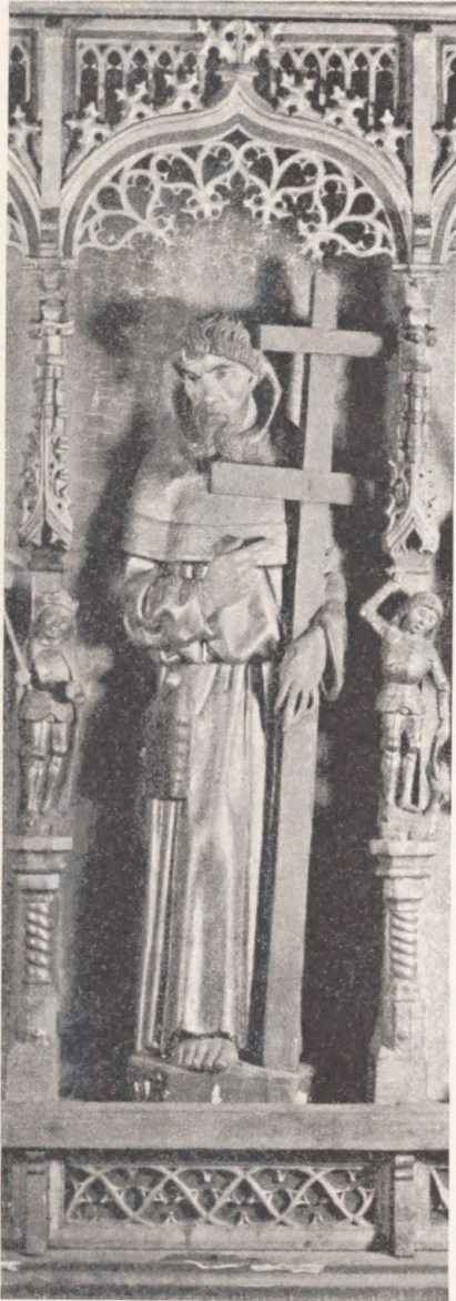
Fig. 6. Apostlen Filip paa Bernt Notke's Altertavle i Aarhus Domkirke. 1479. Nat. Mus. fot.