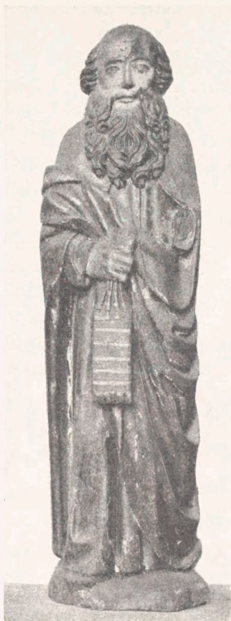
Fig. 10. Apostelfigur fra Havnbjerg Kirke i Nationalmuseet. Ca. 1500.

fastgjort. Dens Maal er: 19,3 cm høj, 15 cm bred, 11,5 cm tyk. (Gengivelse i »Die Österreichische Nationalbibliothek«. 1948, S. 108).