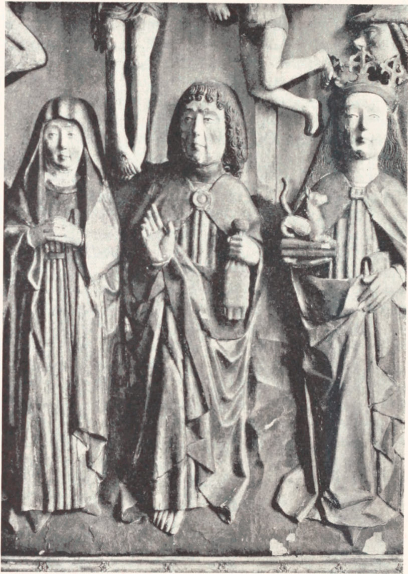
Fig. 11. Johannes Evangelist paa Altertavlen fra Nordlunde Kirke i Nationalmuseet. Ca. 1475-1500.