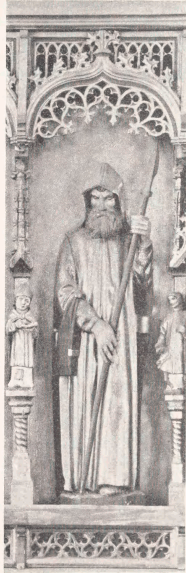
Fig. 7. Apostlen Thomas paa Bernt Not- ke's Altertavle i Aarhus Domkirke. 1479.