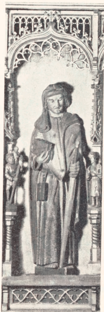
Fig. 5. Apostlen Matthæus paa Bernt Notke's Altertavle i Aarhus Domkirke. 1479.