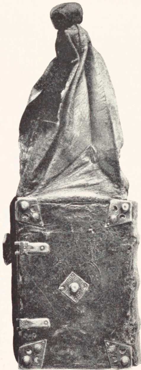
Fig. 1. Posebog paa Det kgl. Bibliotek i København. (Gl. kgl. Saml. Nr. 3423. 8°).