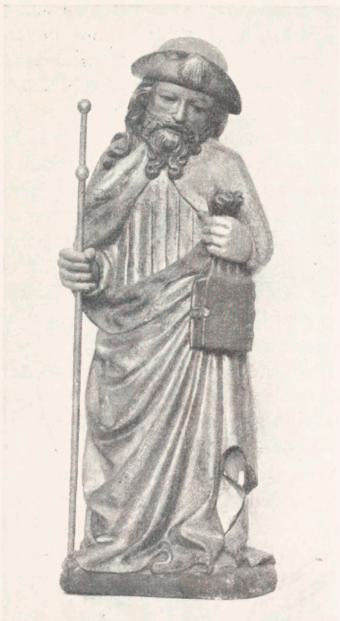
Fig. 9. Apostlen Jacob paa Altertavlen fra Preetz i Nationalmuseet. Ca. 1435.