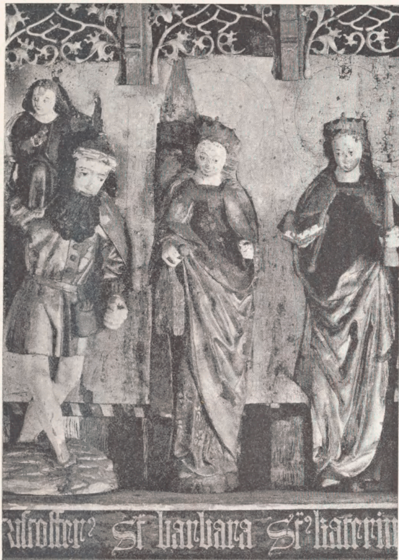
Fig. 12. Sancta Barbara paa Altertavlen fra Faaborg Helligaandskloster i Nationalmuseet. 1511.