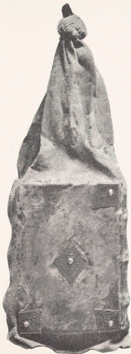
Fig. 2. Posebog paa Det kgl. Bibliotek i København. (Rostgaards Samling Nr. 6.8°).