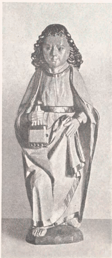
Fig. 18. Johannes Evangelist i Bjerre Kirke. Ca. 1500.