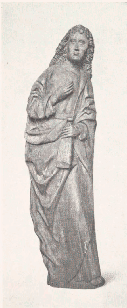
Fig. 16. Johannes Evangelist i Lyderslev Kirke. Ca. 1500. »Danmarks Kirker«.