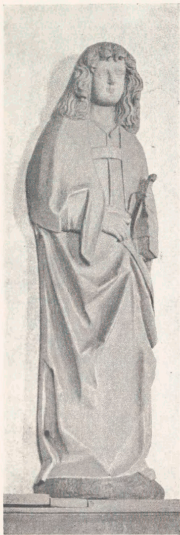
Fig. 15. Johannes Evangelist i Lunde Kirke. Ca. 1500.