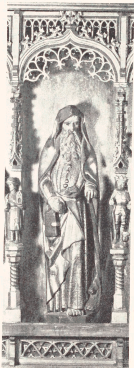
Fig. 4. Apostlen Judas Thaddæus paa Bernt Notke's Altertavle i Aarhus Domkirke. 1479.