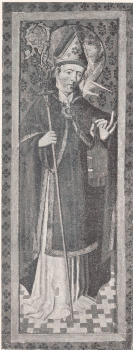
Fig. 13. Biskop paa Sidefløjen af Altertavlen fra Nordlunde Kirke i Nationalmuseet. Ca. 1475-1500.