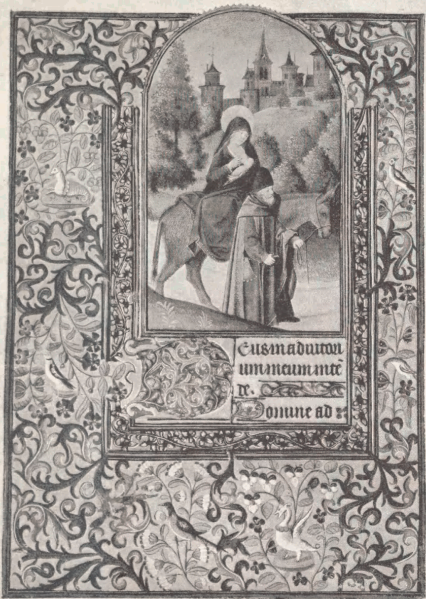
Side af den af Det kgl. Bibliotek nylig erhvervede franske Tidebog med Miniatur forestillende Flugten til Ægypten.