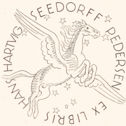
Fig. 3. Digteren Hans Hartvig Seedorff Pedersen.