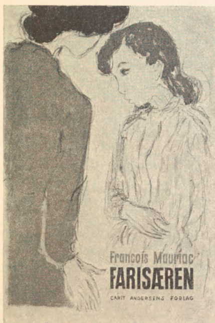
Litograferet bogomslag af Frede Christoffersen.

FOR VENNER af grafisk kunst vil det maaske være af interesse at vide, at der imellem de mange nye bogomslag, som