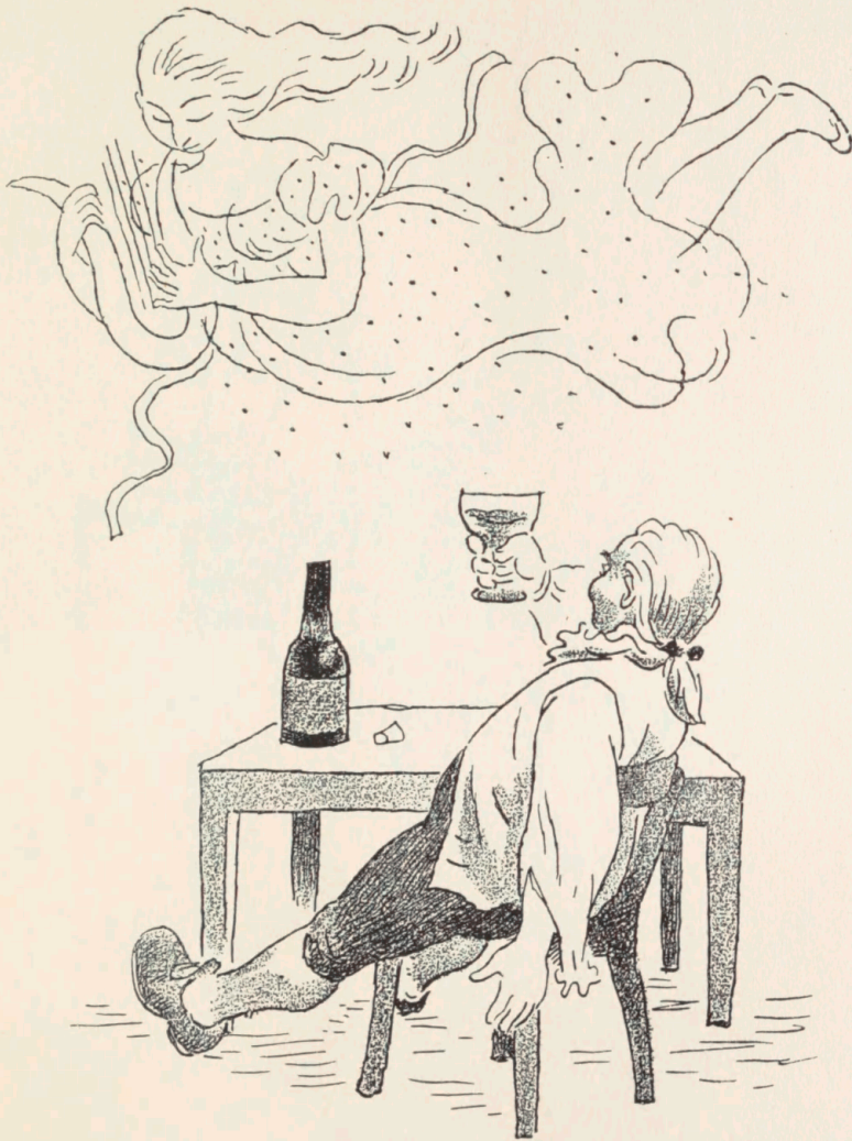
Arne Ungermann: Illustration til Wessels digte.