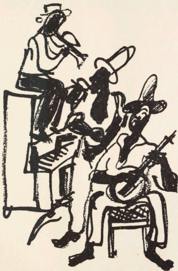
Leo Estvad: Illustration fra »Den spraglede Verden«.