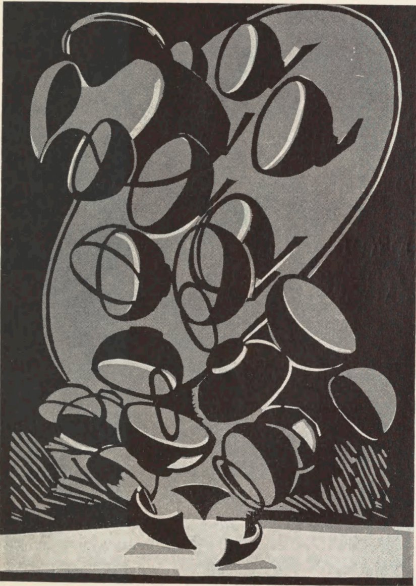
Træsnit af Axel Salto til en af de seneste publikationer.