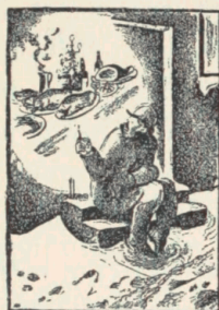
H. C. Andersen og samfundet.