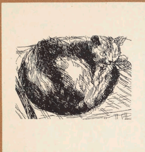
RADERING AF SEGONZAC

MEDDELELSER FRA FORENING FOR BOGHAANDVÆRK REDIGERET AF EBBE SADOLIN