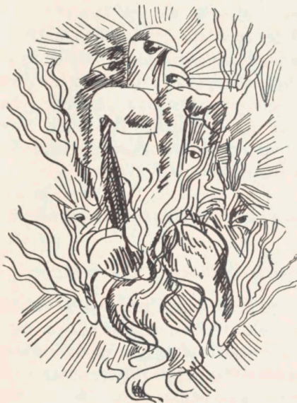
Vignetterne er efter tegninger af Axel Salto.

Paa den ene Side staar de absolute Brugsgenstande, hvis Form fra Aar til Aar slibes mere og mere formaalstjenligt til, den ligger i det væsentlige fast. Hertil hører Telefonbogen og statistisk Aar bog, der er en meget smuk Tryksag. Til den samme Kategori, den funktionelle Bog, hører rettelig ogsaa Romanen, og her har Forening for Boghaandværk gjort en forfriskende Indsats ved Udgivelsen af Gorki's „Min Barndom“, en i det væsentlige mønsterværdig omend noget glædeløs Publikation. Det er en heldig Retning, dansk Bogtryk her er slaaet ind paa, væk fra Pastichen og alt det gamle Optryk, som tager Pengene og Maskinerne, men ved Siden af Arbejdet med Bogen som Meddelelsesinstrument maa løbe den tilsvarende Rendyrkning af Bogen som Kunstværk, hvor alle den moderne Tryktekniks Muligheder kommer til Udfoldelse. Til denne 2den Kategori hører Bogen med fotografisk Udstyr, hvis Betydning man ikke kan sætte højt nok, paa Grund af denne Teknisk voldsomme Udvikling og saa Bogen som den i egentlig Forstand kunstneriske Ting, hvor Tekst og Dekoration smeltes suverænt sammen. Her ligger efter min Mening Bogkunstens store Mulighed for Fornyelse ved Maskinens Hjælp, Dybtryk og Farver. Hvis Kunstneren og Bogtrykkeren kan se bort fra Traditionen, ligesom Gutenberg gjorde, da han opfandt Bogtrykker-