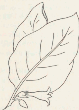
Udkast til blindtryk tegnet af Anker Kyster.