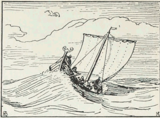
Illustration af Niels Skovgaard til en folkelig Udgave af Bjovulf-sagnet. (Gyldendal.)

Elementer, førte mig længere og længere ind til et Væsen, som levede sit eget Liv.