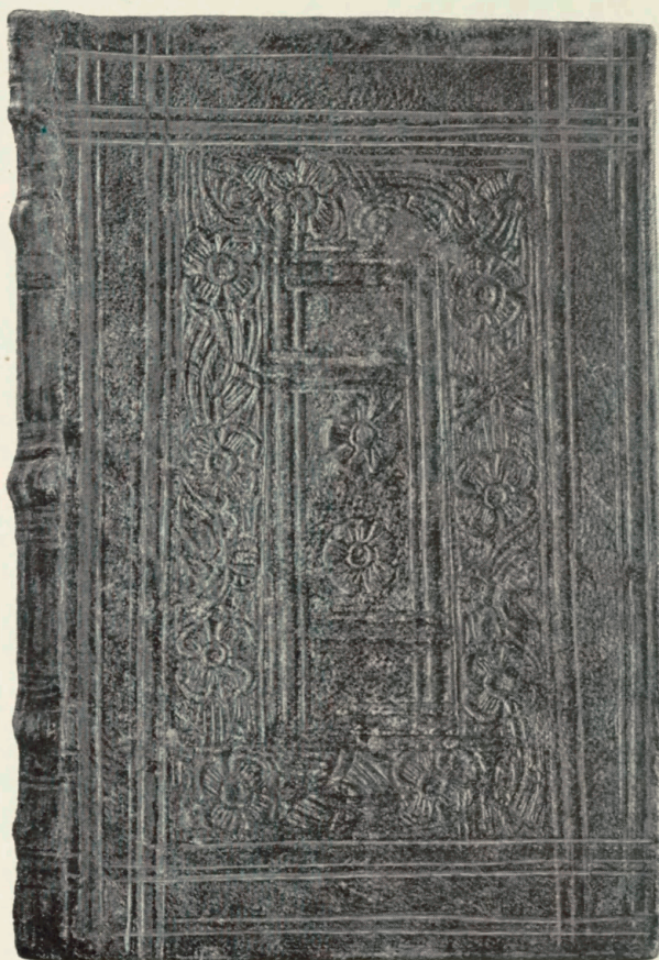
Tavle 8. Dominicale. Hólar 1750. Univ. Bibl.