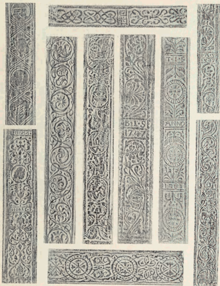
Tavle 11. Islandske Rullestempler.