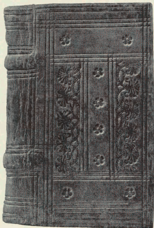
Tavle 7. Exercitium precum. Skálholt 1692. Univ. Bibl.