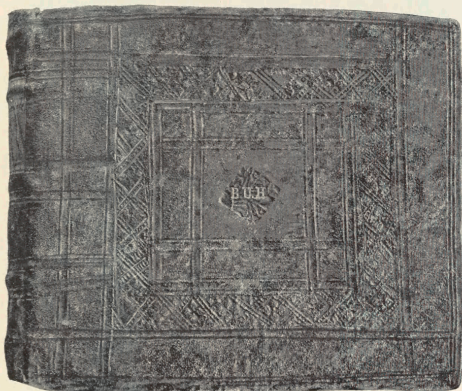
Tavle 9. Graduale. Hólar 1779. Univ. Bibl.