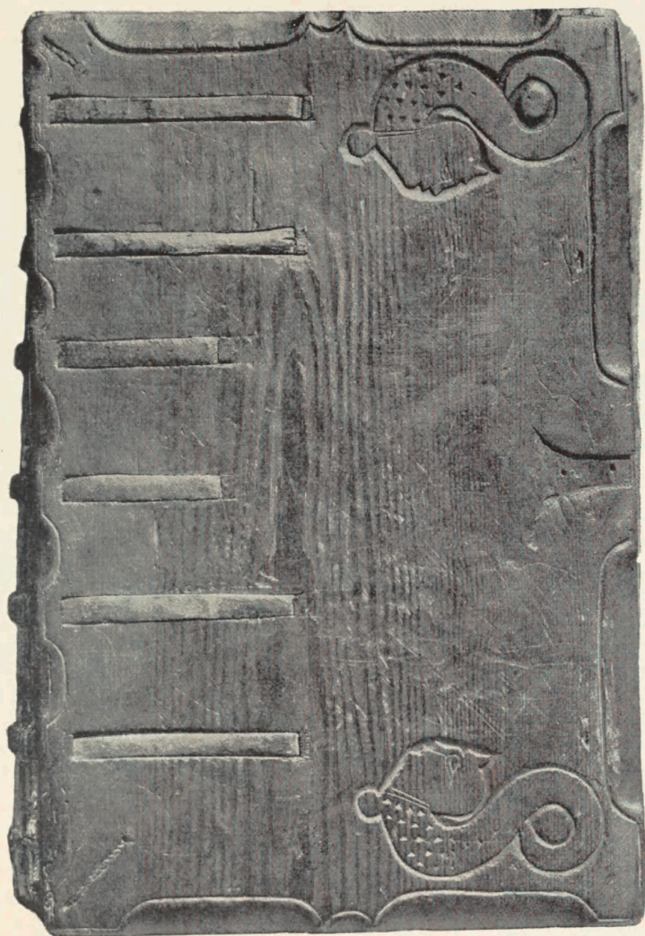
Tavle 1. Stjorn m. m. Arnamagnæanske Samling 225 Fol. Manuskript fra første Halvdel af det 15. Aarhundrede.