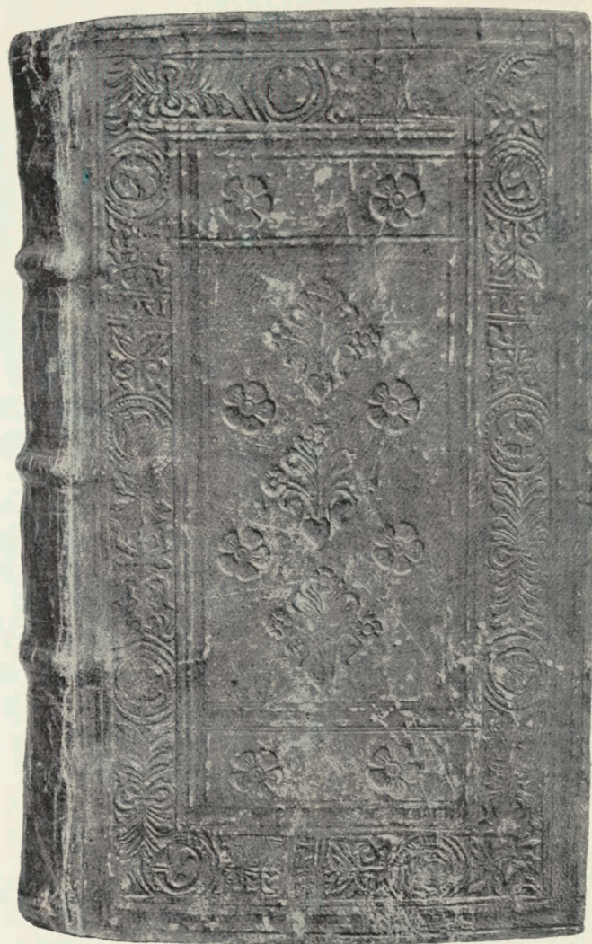
Tavle 4 Psalma book. Hólar 1742. Kgl. Bibl. Hielmst. 1308a 8vo.