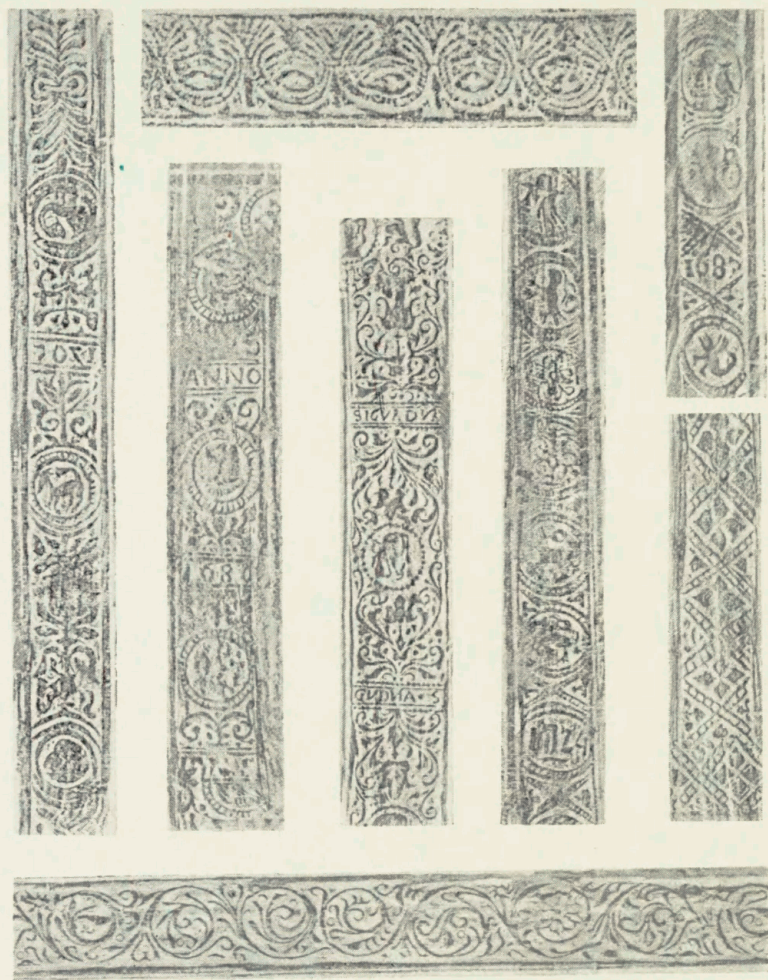
Tavle 12. Islandske Rullestempler.