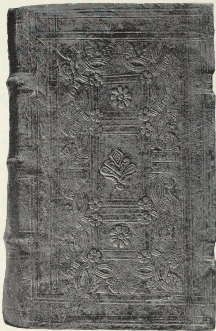
Tavle 2. Phil. Nicolai, Theoria vel speculum vitae eternae. Hólar 1608. Kgl. Bibl. Hielmst. 845 8vo.