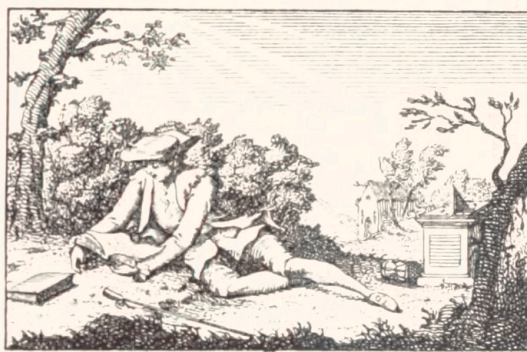
Fallitur Hora Legendo.

Jeg var nemlig kommen paa den ganske nærliggende Tanke, at den omhandlede Bogsamling muligvis var bleven solgt paa Auktion, og at Det kgl. Bibliotek var optraadt som Køber paa denne. Og saa begyndte jeg at gennemgaa Arkivsagerne vedrørende Bibliotekets Bogkøb paa Auktioner siden 1762, Trykkeåret for den yngste af de Bøger, hvori jeg havde fundet Exlibriset. Denne Undersøgelse simplificeredes betydeligt ved, at jeg blandt de Bøger, som havde Exlibriset, valgte kun at søge efter en enkelt, nemlig Martins franske Oversættelse af Biblen i Folio fra 1746. I ældre Tid var det