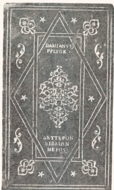
Bind udført for Damianus Pfluck.

er da, at derfor maa alle Grolier-Bind være Pariser-Arbejder og disse to Bind, eo ipso, være udgaaet fra Grolier-Mesterens Haand.