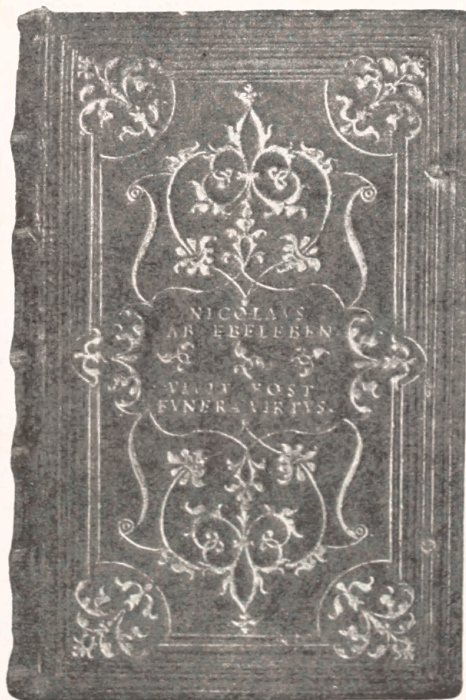
Bind udført for Nicolaus von Ebeleben.

Begge disse Bind er smykket med Stempler, hvoriblandt kendes flere af de fra Grolier's første Bind, og Rudbeck's Konklusion