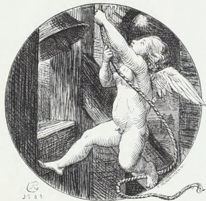
Træsnit efter Tegning af AUG. JERNDORFF. (»Vignetter« 1877.)

baade i tidligere Dage og i sine sidste Aar. Hvor lykkeligt og bredt han evnede at føre Pennen viser det i Fotolitografi trykte Omslag til et Musikhæfte, som her gengives i lidt formindsket Maal. Sammen med de andre Prøver paa hans Illustrationskunst, som vi har kunnet samle, giver det et Begreb om Udviklingen, han gennemløb. I Modsætning til den Skæbne, der ellers er fælles for Kunstnere, at slige smaa Arbejder taber i Kraft og Friskhed, naar Ungdommen er forbi, vandt Jerndorff stadig fremad og hans Illustrationer fik en dekorativ Holdning, der ikke før var naaet hos os. — I sine senere Aar gav han selv villigt TH. BINDESBØLL'S Indflydelse Part i Resultatet, naar dette var godt, i ethvert Tilfælde blev det nære Forhold, der gennem mange Aar bestod mellem Jerndorff og Bindsbøll, et gensidigt befrugtende. Jerndorff var den forsigtigere og mere maadeholdne i Brugen af de kraftige Midler, og han dulmede nu og da Bindsbølls Glubskhed, men selv fik han til Gengæld Mod til at bruge Sort og Hvidt med et Fynd, som stammede fra Bindsbølls Tilskud i Samarbejdet.