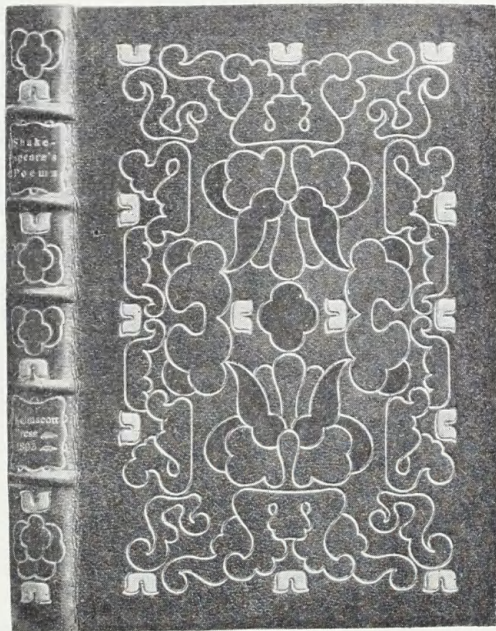
Tre Bind i fuldt Maroquin udførte efter Tegning af TH. BINDESBØLL af ANKER KYSTER.