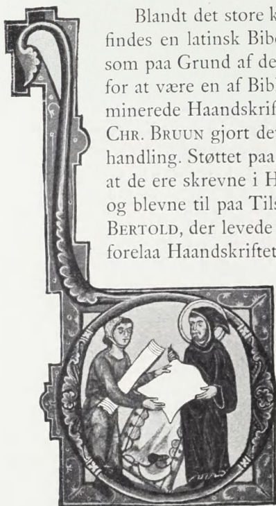
Fig. 1. D , folio 183 recto.

Blaat D -Initial i 5 \times 5 cm. stor purpurfarvet Ramme ved Sankt Hieronymus' Prolog til Daniels Bog. Guldgrund. Figur til højre Kappe sort; Figur til venstre Klædning purpurfarvet, Hovedbedækning hvid med sort Netmønster. Rammen mellem Figurerne, der viser det udspændte Skind, er brungul med sorte Huller, Knivskafet rødt.