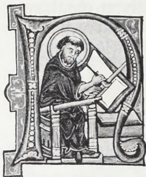
Fig. 2. A, fol. 195 r.

Blaat N-Initial i 5,1 × 4,2 cm, stor purpurfarvet Ramme ved Sankt Hieronymus' Prolog til de 12 smaa Profeter. Guldgrund. Figurens Kappe sort, Knivskæft sort, Lineal gulbrun, Pergamentunderlag zinnoberrødt. Paa Gulvet til højre violet Pult med hvid Skala.