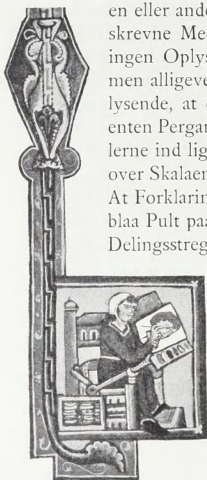
Fig. 8. III, folio 208r.

Underste Del af blaet og hvidt (delvis broget) A-Initial i 3,8 x 4,1 cm. stor rød Ramme ved Apokalypsen. Guldgrund. Figurens Klædning blaa, Hovedbedækning hvid, Pergamentunderlag grønt, hvorpaa er afsat forskellige Farver. Brogede Farver i Rammen (Kassen) forneden til venstre.