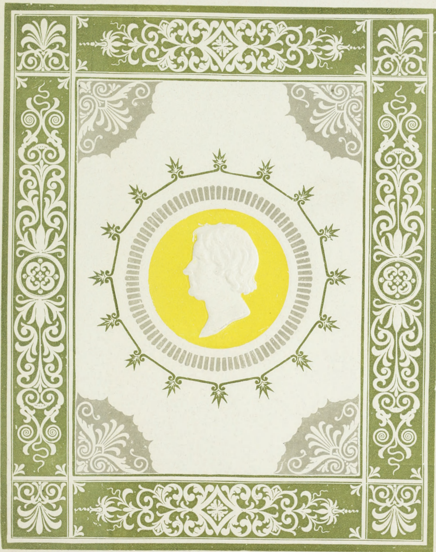
AFTRYK AF GAMLE CONGREVE-PLADER MED THORVALDSENS PORTRÆT-MEDALJON OPRINDELIG FREMSTILLEDE I DET BERLINGSKE TRYKKERI I SLUTNINGEN AF TREDIVERNE