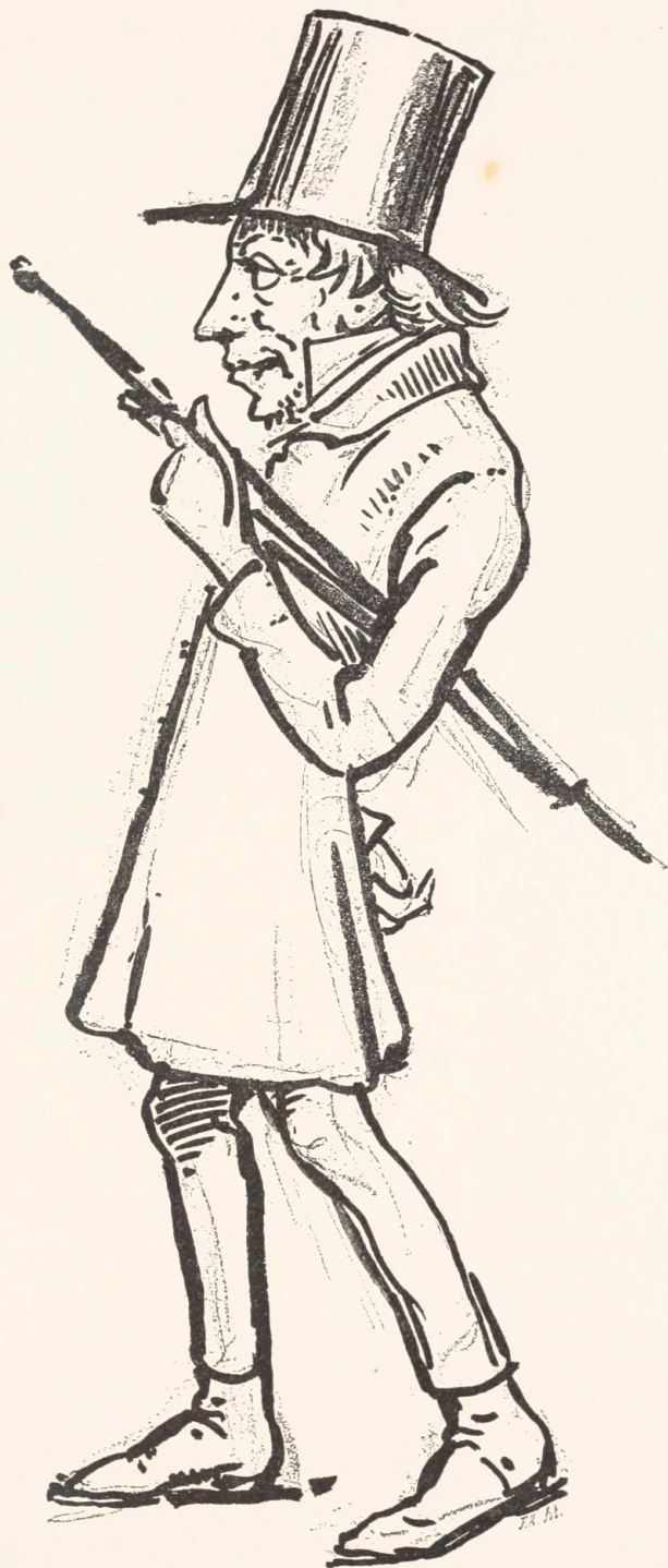
SØREN KIERKEGAARD. Efter en Tegning af V. Marstrand.