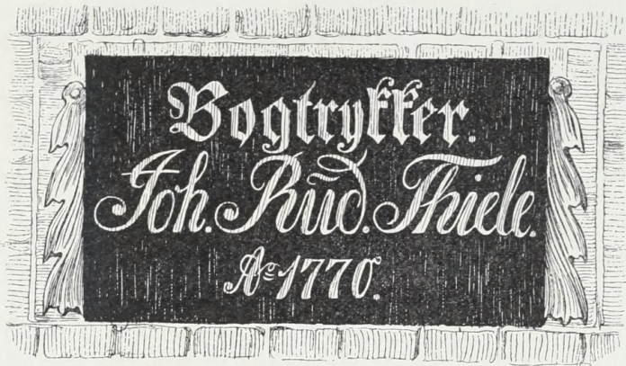
Det gamle Skilt over Trykkeriets Port.