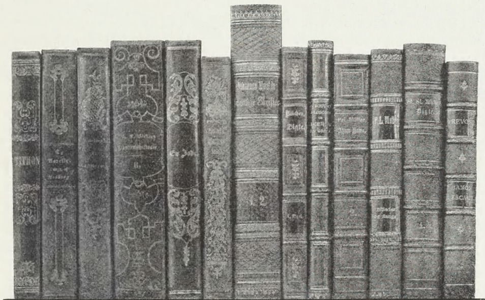
Danske Bogrygge fra c. 1840—c. 1880. 1

Midt i Fyrrerne var Chagrinskindet kommet hertil. Dette matte, kornede Skind, som egner sig saa fortrinligt til Blindtryk sammen med Guld, blev mere og mere taget i Brug til »Franskbind«. Den almindeligste Dekoration til disse var 4 ophøjede Bind med Linjer eller smalle Borter over og Blindtryk langs dermed, eller en blind Ramme af en grov og en fin Linje omkring hvert Felt, den fine Linje undertiden i Guld. Fra Halvtredserne og navnlig Tredserne bleve disse Rygge stadigt brugte til hvad der skulde være lidt ud over det almindelige. Det er tørre, kedelige Bind, tilmed da de næsten altid holdtes i mørke Farver. Det lille Stempel, man i Halvfjerdserne begyndte at sætte i hvert Felt, liver Ryggen ganske anderledes op. Samtidigt kom lysere Farver i Brug, Forgylningen blev mere sirlig og net, de ornerede Fileter