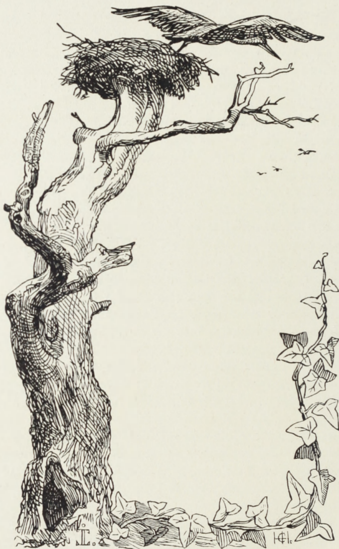
Træsnit af HENNEBERG efter JOH. TH. LUNDBYES Tegning. (Randtegning til et Digt.)

her bliver arbejdet grumme meget højt maadeligt og rent fabrikagtigt, og De vil maaske savne Akademiet noget; dog troer jeg, at De har høstet